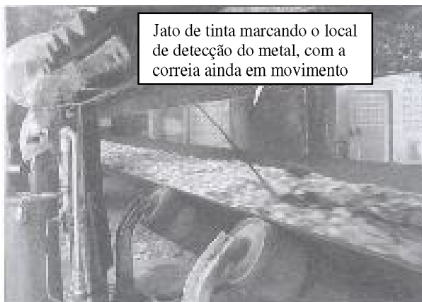
Figura 2 – Demarcação do jato de tinta no metal com correia em movimento