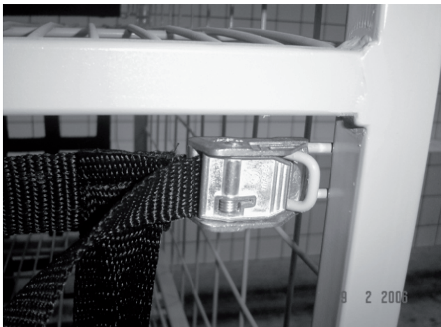
Figura 2: Fecho utilizado em Container para distribuição Porta a Porta