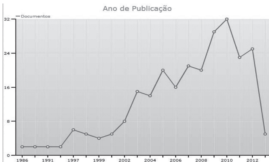
Gráfico 1 - Crecimiento de la publicación de artículos sobre el tema

Este artículo se objetiva promover la identificación de perfil de negociador brasileño de modo que se lleve a la comprensión de como relacionarse con negociadores de diferentes culturas, analizando su diferencial en el mercado internacional. Al saber que se trata de un tema de extrema importancia para aquellos que trabajan en el área de la cual hay la necesidad de tratar con personas de diferentes naciones y considerando los indicadores de publicación de artículos con contenido relacionado en los últimos años, se nota que hubo un aumento perceptible por lo estudio de esa temática en medio académico.