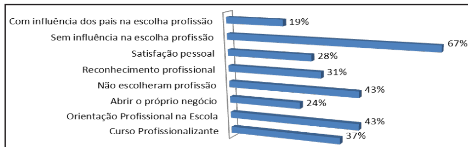
FIGURA 2 – ESCOLHA PROFISSIONAL

Constatou-se que a maioria dos alunos é solteira. Quando perguntados se possuem filhos, apenas 3% responderam que sim. Ainda, 82% dos entrevistados responderam que moram com seus pais e em residência própria, com renda familiar bem distribuída em termos de valores, até R$ 1.000,00 com 22% e com 29% dos entrevistados com renda de R$ 1.001,00 a R$ 2.500,00, renda esta composta por duas pessoas, perfazendo 45% dos entrevistados e 26% com três membros da família trabalhadores. Dos estudantes entrevistados, 29% deles ocupam-se com atividades familiares nos intervalos dos estudos sem contar com qualquer tipo de remuneração. Constatamos que um percentual bem próximo, 27% dos entrevistados, já trabalham com carteira assinada. Em relação ao nível de escolaridade do pai, as respostas sinalizam: ensino primário 18% e pós-graduação 7%. Além desses extremos, as maiores porcentagens referem-se ao ensino fundamental incompleto, com 29% de ocorrência.