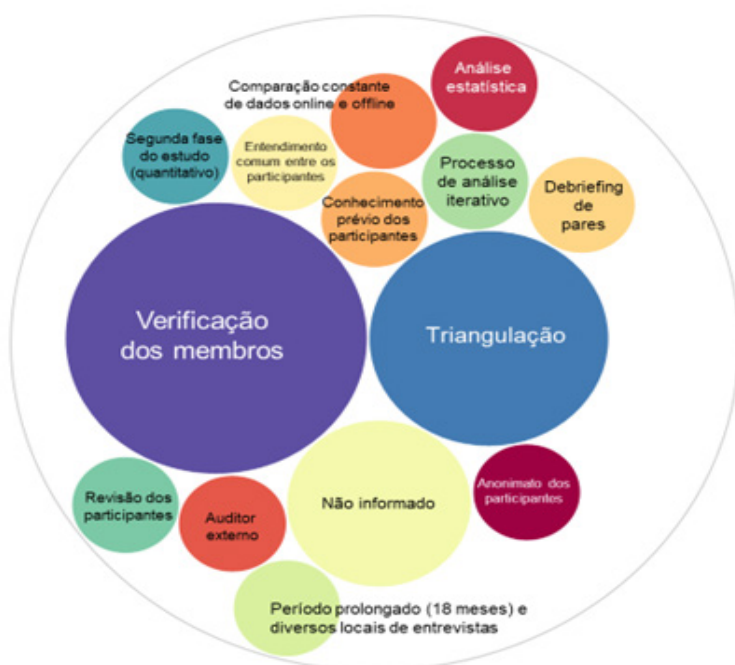
Figura 2 - Técnicas para aumentar a confiabilidade e credibilidade da análise de dados utilizadas nos artigos analisados. Quanto maior o tamanho das esferas, mais a frequência das estratégias no método dos artigos.

verificados. Entretanto, observa-se uma área de atenção pela falta de explicitação da identidade do paradigma de pesquisa e das características dos pesquisadores, assim como, nas questões éticas humanas da pesquisa, o que implica em um espaço para aperfeiçoamento da aplicação da GT em Administração e Negócios, no sentido de qualificar e incentivar a qualidade da pesquisa qualitativa na área.