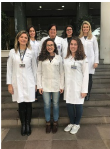
Imagem 1 – Componentes do Projeto em 2017

Com o objetivo de fornecer atendimento fonoaudiológico aos pacientes com fissura lábio-palatina, no período compreendido entre 2013 e 2017, o projeto possibilitou um acolhimento especializado e individualizado. A partir da sua aprovação como projeto de extensão universitária, em 2015, incluiu-se aos seus objetivos o desenvolvimento do conhecimento teórico-prático junto aos alunos do curso de graduação em Fonoaudiologia, possibilitando-lhes o aprofundamento dos seus estudos sobre a patologia e o tratamento fonoaudiológico.