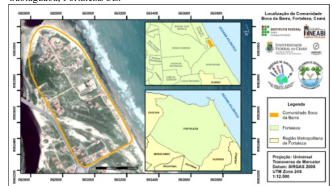
Figura 1 – Mapa de localização da Comunidade Boca da Barra, no Bairro Sabiaguaba, Fortaleza/CE.

Fonte: Elaborado por Oliveira e Santos Júnior (2019).