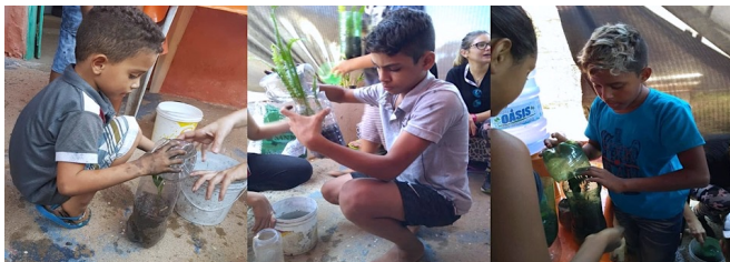
Figura 3 – Construção de Terrários pelas crianças da Biblioteca Comunitária.

Nesta atividade, foi apresentado para as crianças o ciclo da água e o comportamento cíclico dos elementos naturais numa visão sistêmica, sensibilizando os participantes para a importância da água e do solo, para as plantas, animais e seres humanos, como também formas de evitar o desperdício e a não poluição desses recursos. Também houve a construção de terrários simulando o ambiente terrestre, visando estimular o contato com os elementos da natureza, seres vivos e elementos não vivos, observando as interações entre eles e levando-as a refletir sobre o ambiente em que vivem e o papel do homem nesse ambiente.