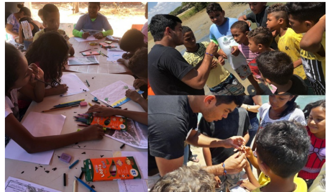
Figura 4 – Elaboração dos Mapas Mentais e atividade externa à Casa Camboa.

No terceiro encontro, elaboraram Mapas Mentais indicando as fontes de água da comunidade. Posteriormente, foi realizada uma atividade externa à Casa Camboa, em que foi feita a análise da qualidade da água em torno da comunidade.