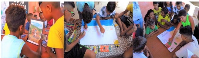
Figura 2 – Crianças participantes desenhando o ambiente onde vivem, a Boca da Barra.

Nesta oficina, foi executada a atividade “De onde viemos? Quem somos? Para onde vamos?”, que consistia na compreensão sobre a identidade e sua ligação com a comunidade. As crianças tiveram contato com fotografias de algumas pessoas, locais e práticas da comunidade, como pesca e turismo para o reconhecimento visual. Na segunda parte da atividade, as crianças foram divididas em grupos e desenharam a Boca da Barra antes, agora e o que elas pensam que seja daqui a 30 anos, conforme observado na Figura a seguir.