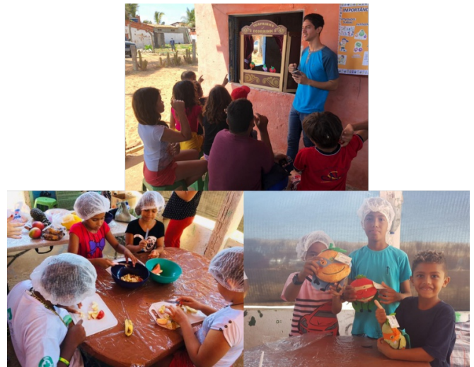
Figura 5 – Registro do teatro com frutas fantoches e elaboração da salada de fruta coletiva.

Esta oficina teve como base a elaboração de uma salada de frutas coletiva, em que as crianças fizeram a higiene corporal adequada para praticar os cortes corretos nas frutas ofertadas pela equipe. Além disto, houve um teatro com frutas fantoches para despertar o interesse das crianças em se alimentar adequadamente, trazendo à tona as vitaminas que cada fruta oferece.