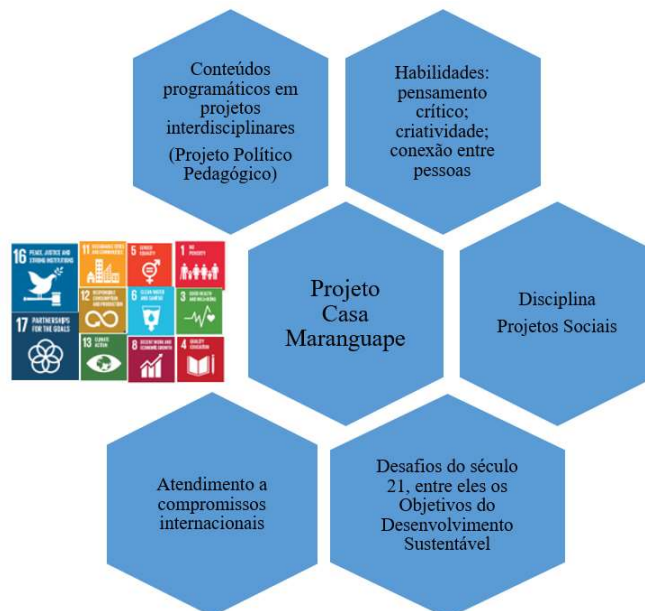
Figura 2 – Análise comparativa das ações de extensão do Projeto Casa Maranguape no contexto educacional com relação aos Objetivos do Desenvolvimento Sustentável

A terceira etapa de análise realizada nesta investigação foi o tratamento dos dados, por meio de análise comparativa com enfoque no contexto educacional, sobre se a experiência da ação extensionista no Projeto Casamar englobou a atuação relacionada a programas internacionais, a exemplo dos Objetivos do Desenvolvimento Sustentável (ODS). Essa relação pode ser observada no Quadro 2 e na Figura 2.