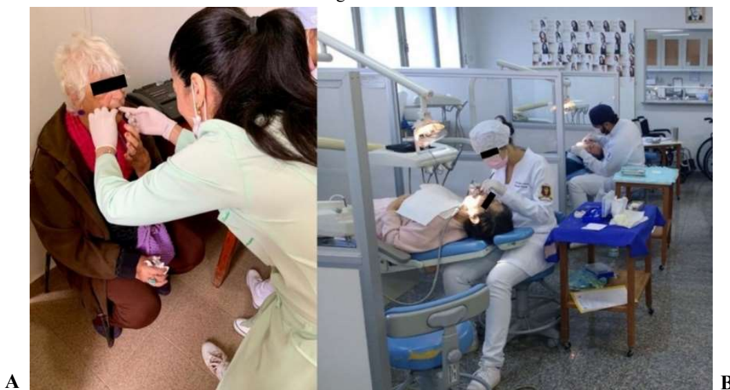
Figura 1 - (A) Atendimento realizado na ILPI; (B) Atendimento realizado na Faculdade de Odontologia da UNIFAL-MG.

Entretanto, quando necessários procedimentos mais complexos, que demandavam equipamentos específicos e inexistentes na ILPI, tais como motores de alta rotação movidos a ar comprimido, sugadores de alta potência e ambiente controlado para realização de procedimentos mais invasivos, os idosos eram conduzidos às clínicas odontológicas da UNIFAL-MG (Figura 1B), em transporte próprio da ILPI, acompanhados por uma cuidadora responsável. Dessa maneira, todas as especialidades clínicas eram contempladas de acordo com a demanda de cada idoso, sendo realizados tratamentos periodontais, cirúrgicos, endodônticos, restauradores diretos e indiretos.