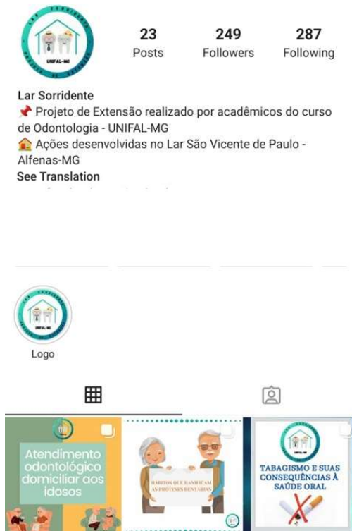
Figura 2 - Visão da página inicial no Instagram do Projeto de Extensão Lar Sorridente.