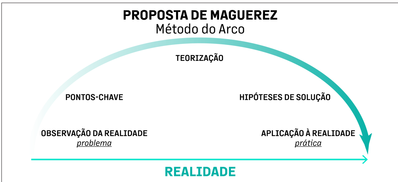
Figura 1 - Ferramenta Arco de Maguerez

1ª Elaboração de materiais educativos sobre cuidados perioperatórios, segundo o Método do Arco criado por Charles Maguerez, e difundido no Brasil por Paulo Freire, utilizando-se os pressupostos da Andragogia.