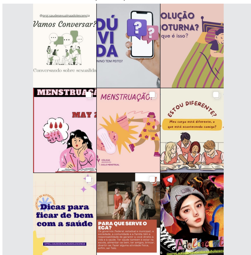
Figura 2 – Postagens no Instagram sobre promoção da saúde, prevenção de doenças e agravos e atenção à saúde do adolescente. Sobral, Brasil, 2025.

A Figura 2 apresenta algumas postagens no Instagram , durante a primeira semana.