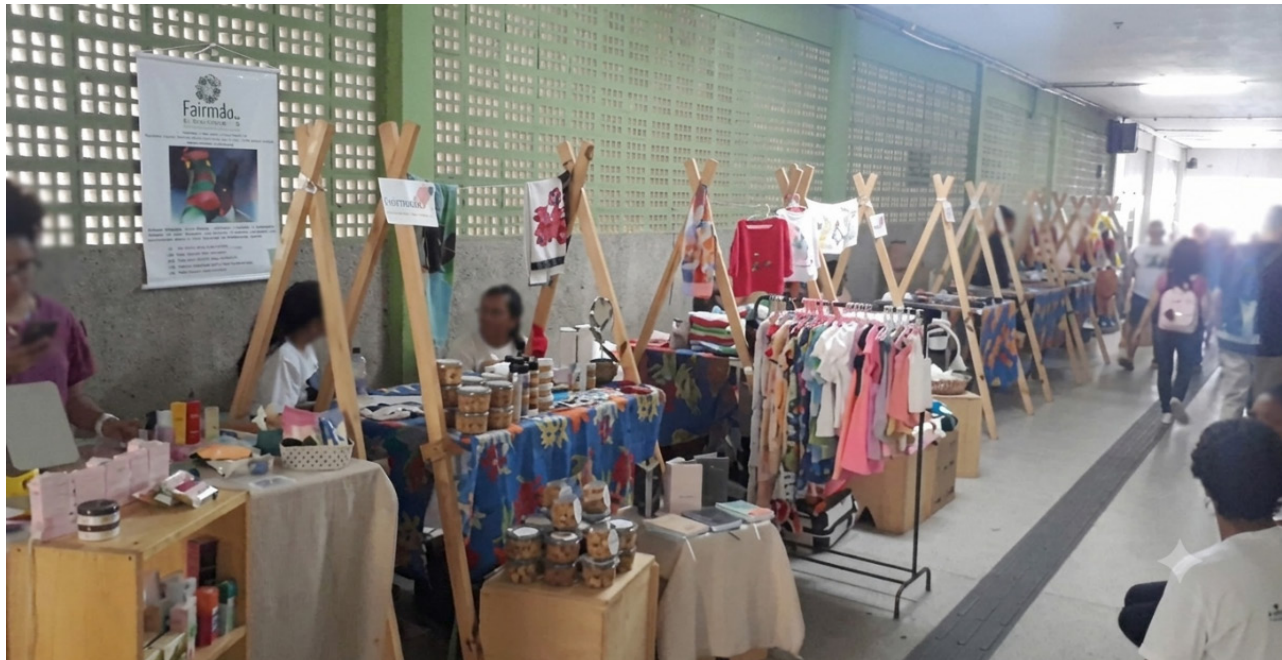
Figura 2 – Registro da feira com a oferta dos produtos

Já a Figura 2 é responsável por ilustrar a realização da Feira de Talentos durante sua execução, evidenciando os espaços expositivos organizados para a comercialização e divulgação dos produtos e serviços ofertados pelos empreendedores participantes. Observa-se a diversidade de segmentos representados, incluindo artesanato, vestuário, cosméticos e produtos alimentícios.