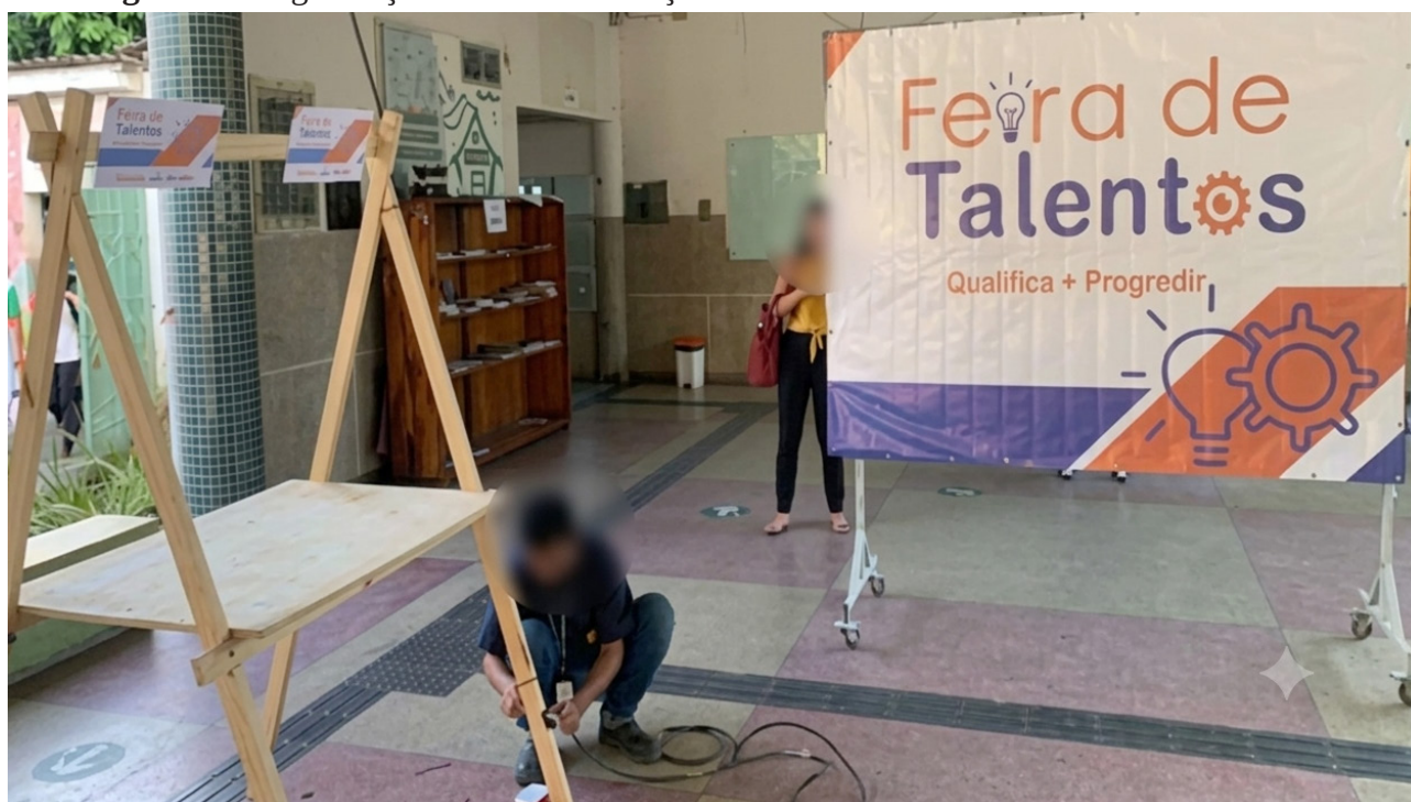
Figura 1 – Organização da feira – 1ª edição

A Figura 1 apresenta o momento de organização da estrutura física da primeira edição da Feira de Talentos do Qualifica + Progredir. Observa-se a montagem dos espaços expositivos e a atuação de um membro da equipe organizadora na preparação do ambiente destinado à recepção dos empreendedores participantes.