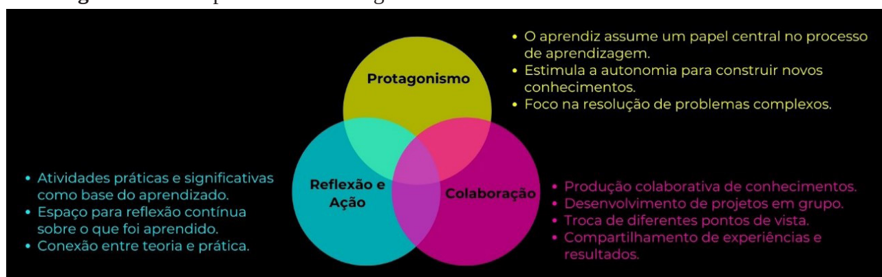
Figura 1 – Princípios das metodologias ativas