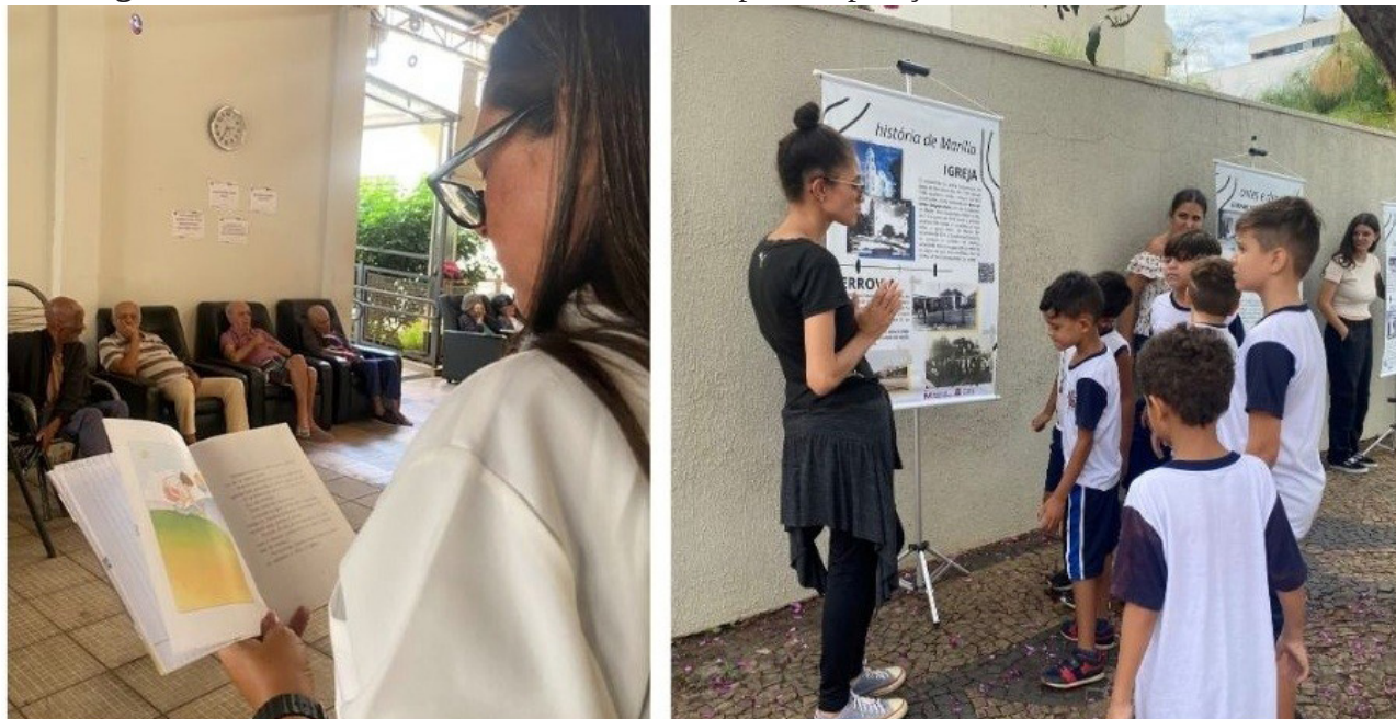
Figura 3 – Alunos nas atividades de biblioterapia e exposição

Na Figura 3 são apresentados os alunos em algumas das ações extensionistas realizadas.