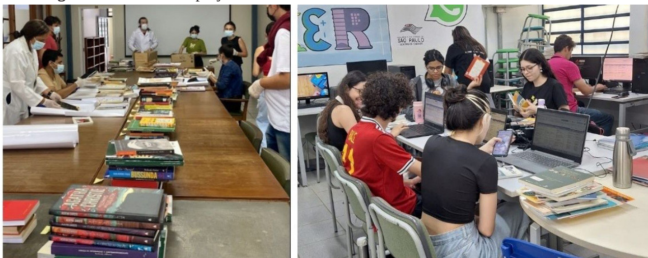
Figura 2 – Alunos nos projetos com acervos

Na Figura 2 são apresentados os alunos nas ações da biblioteca comunitária e nas atividades de revitalização de acervo.