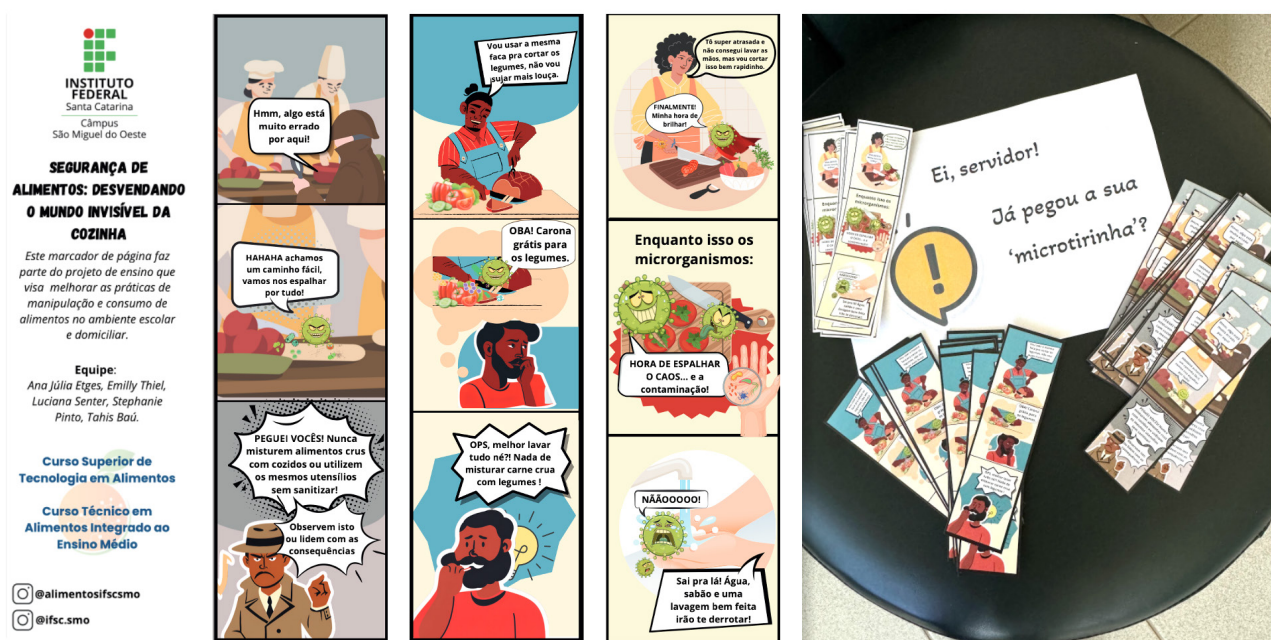
Figura 2. Marcadores de página distribuídos à comunidade escolar, abordando temas de higiene e manipulação de alimentos.

As oficinas educativas foram conduzidas no formato expositivo-dialogado (Figura 3), o que favoreceu a participação ativa dos estudantes. Durante as atividades, os participantes assistiram ao vídeo produzido, receberam os materiais impressos e tiveram espaço para esclarecimento de dúvidas, além de serem estimulados por meio de perguntas interativas sobre práticas cotidianas na cozinha coletiva. Um diferencial relevante da oficina foi a possibilidade de manusear placas de Petri e observar colônias microbianas ao microscópio, o que despertou grande curiosidade e impacto visual entre os participantes. Essa abordagem prática e sensorial contribuiu para tornar os resultados microbiológicos mais concretos e compreensíveis, fortalecendo o processo de sensibilização. Assim, a integração entre o diagnóstico científico e as estratégias educativas mostrou-se eficaz para promover a reflexão crítica sobre os hábitos de higiene e de manipulação de alimentos, reforçando o potencial das ações de extensão universitária na promoção da segurança alimentar em ambientes escolares coletivos.