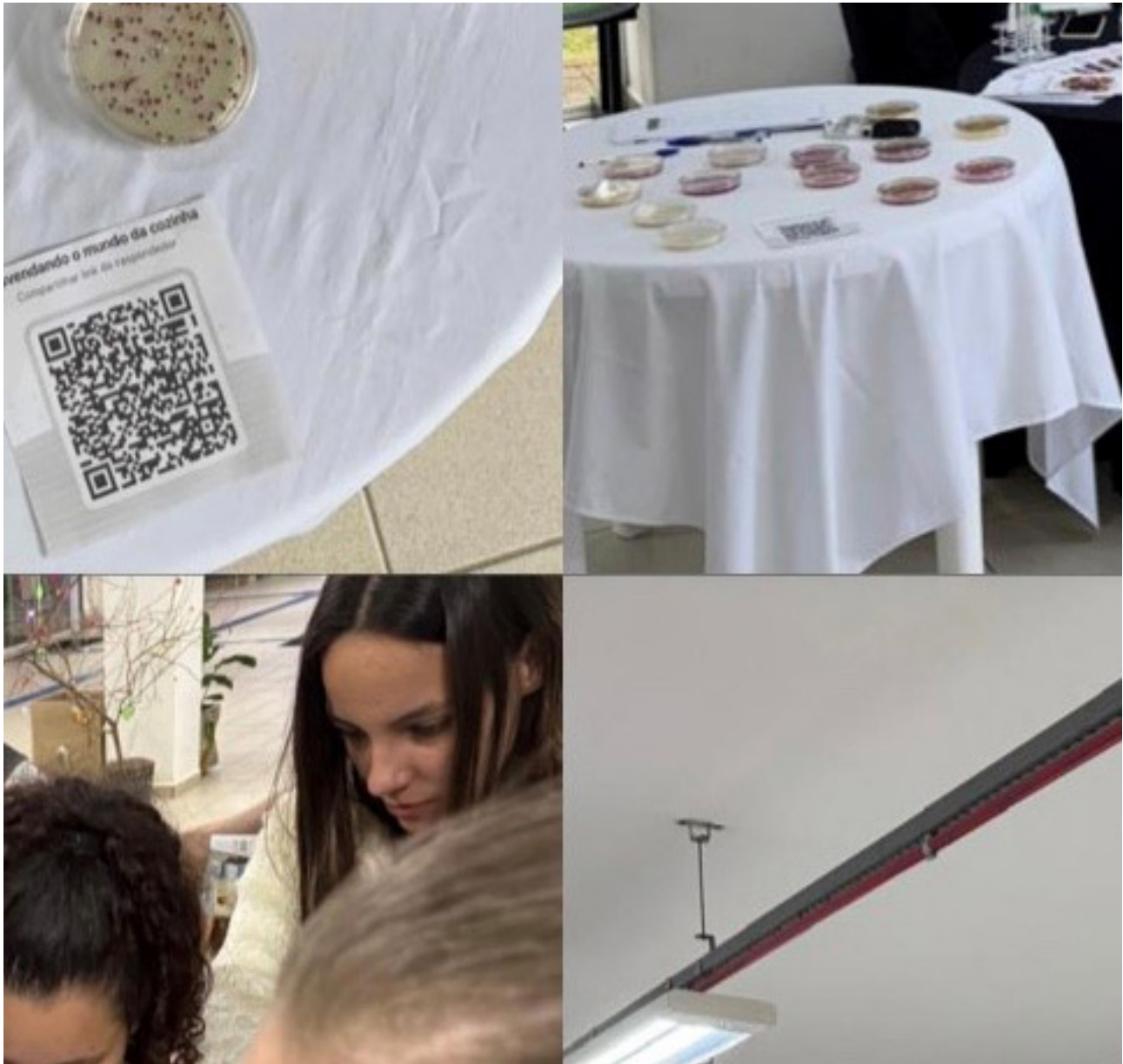
Figura 3. Oficina realizada com os estudantes sobre higiene e manipulação de alimentos.

Oliveira et al. (2025) desenvolveram uma ação extensionista com foco na conscientização de crianças sobre a relevância da higienização adequada das mãos e dos alimentos como medida de prevenção de doenças de origem alimentar. A proposta metodológica baseou-se na utilização de estratégias educativas lúdicas, que incluíram atividades interativas, demonstrações práticas de higienização e o emprego de recursos visuais, favorecendo a participação ativa do público infantil. Os autores observaram que a abordagem adotada facilitou a assimilação dos conteúdos e estimulou a adoção de hábitos mais saudáveis, evidenciando que intervenções educativas simples, quando planejadas adequadamente ao perfil do público-alvo, podem gerar resultados expressivos na promoção da saúde e na prevenção de infecções alimentares.