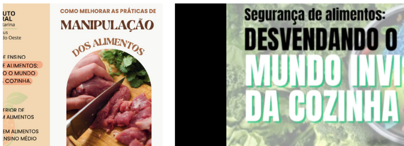
Figura 1. Produtos de extensão, confeccionados para a realização da oficina sobre higiene e manipulação de alimentos: a) folder impresso entregue aos participantes; b) vídeo publicado no YouTube®.

De acordo com Fewtrell (2005), materiais visuais, como cartazes e folhetos, são cruciais para informar os participantes, sendo necessário também incluir outras estratégias educativas que promovam mudanças comportamentais. Assim, foram apresentadas placas de Petri com crescimento microbiano representativas das diferentes áreas amostradas, bem como foi preparado o uso de um microscópio óptico, com o objetivo de proporcionar aos participantes contato direto com os resultados microbiológicos, fortalecendo a compreensão da presença e da disseminação de microrganismos no ambiente da cozinha coletiva.