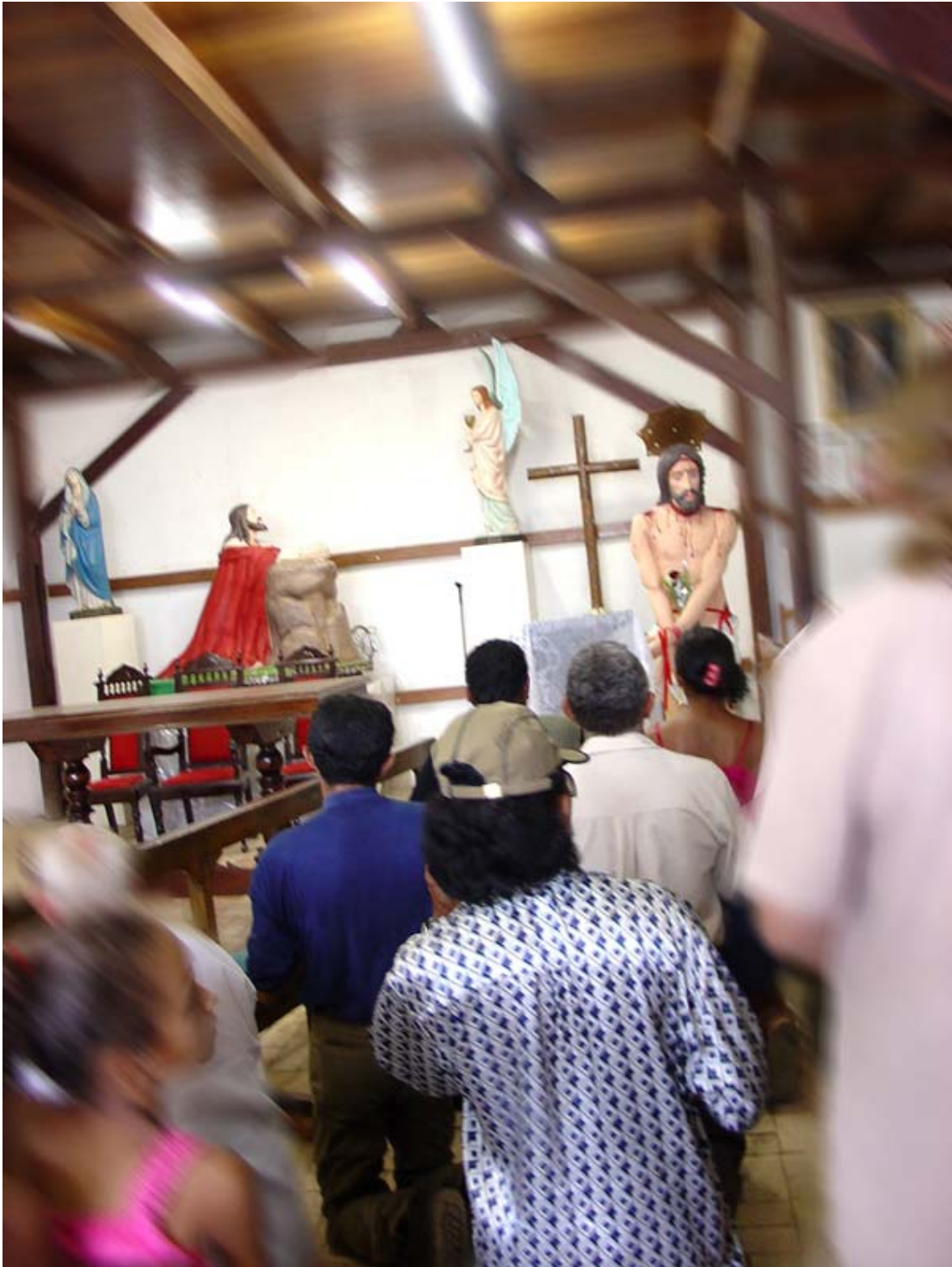
Dentro do casarão