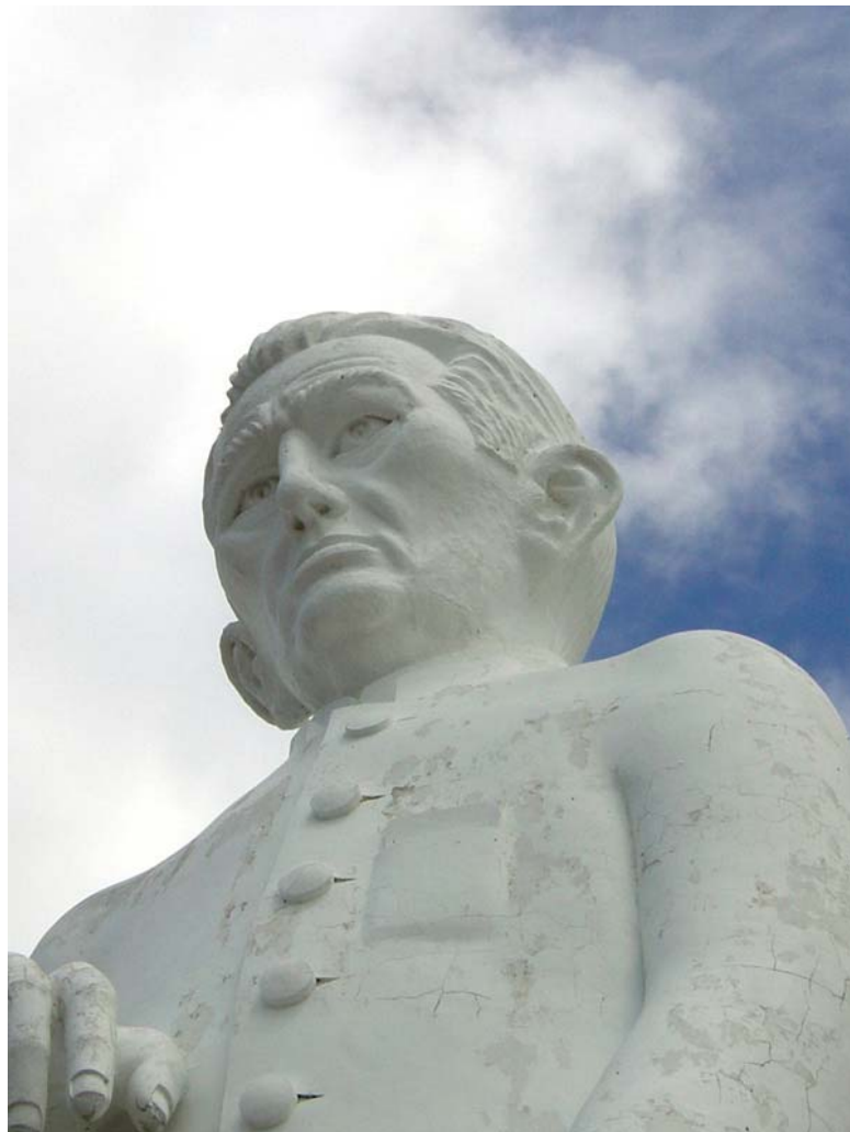
A estátua do Padre Cícero, zelando por Juazeiro