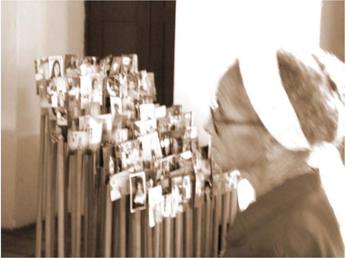
Devoção no altar