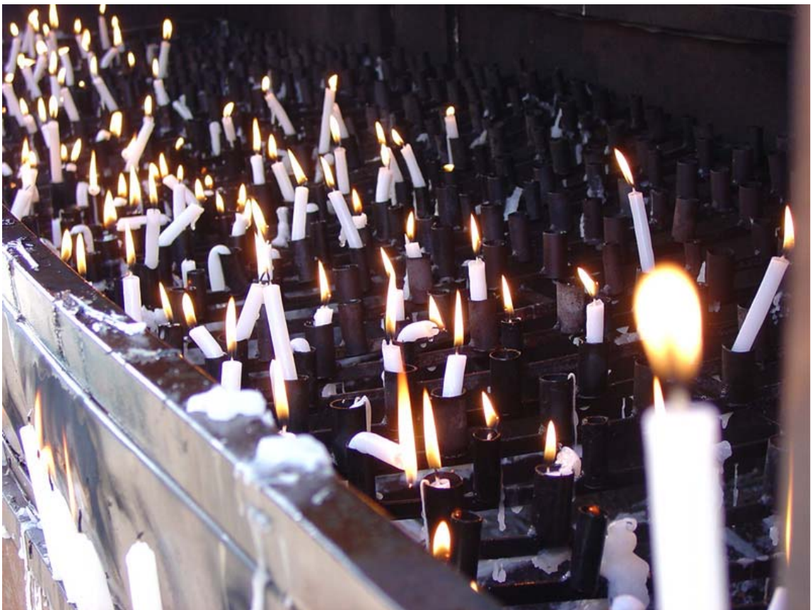
Chamas da devoção