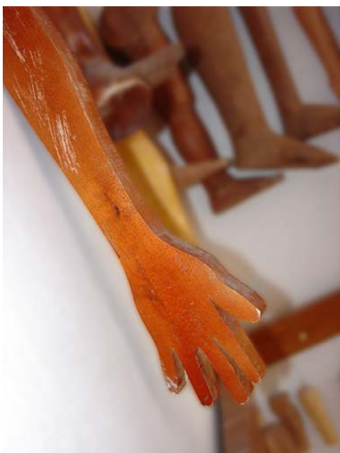
Braços e pernas