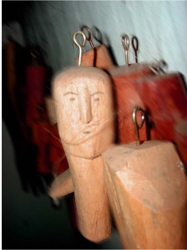
Ex-votos de madeira