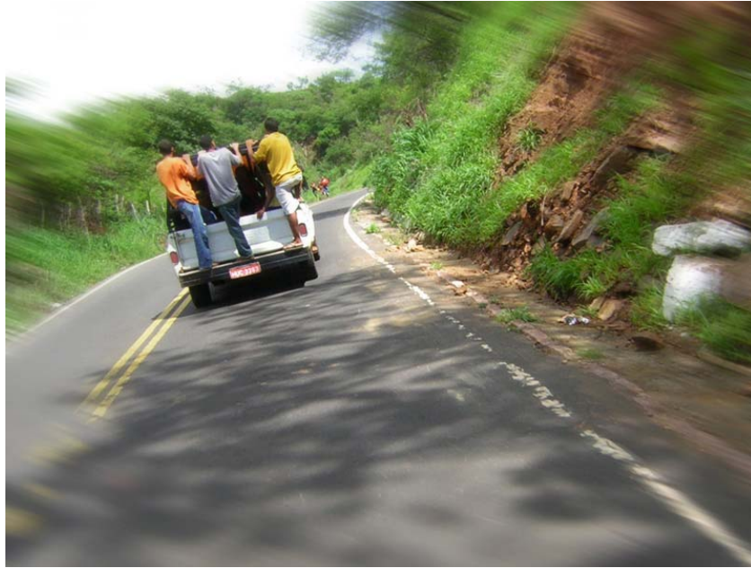
Subida à Colina do Horto