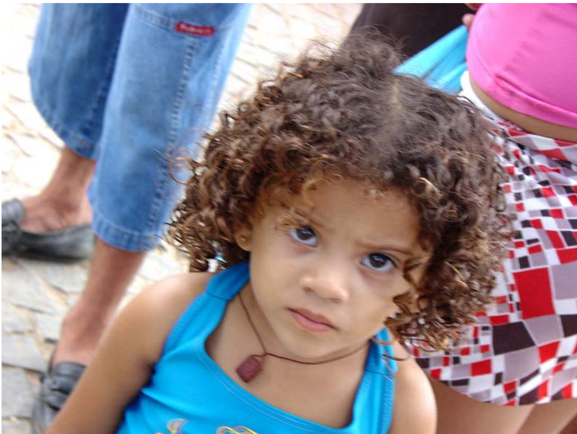
Olhar de indagação