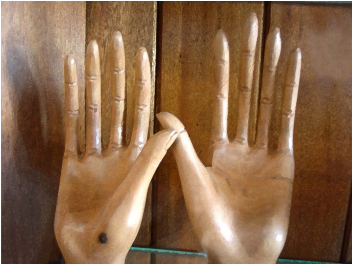
Mãos aos céus