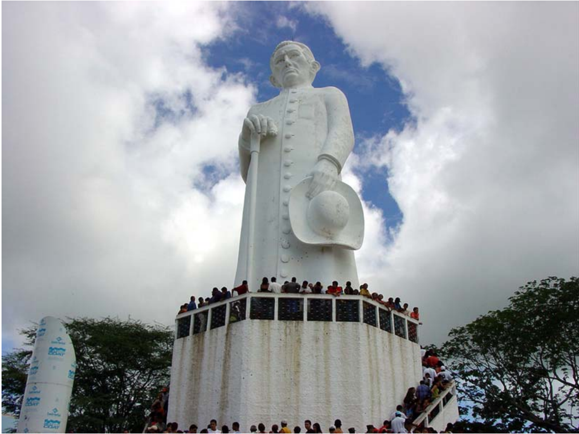
Ao redor do Padim e sempre para o alto