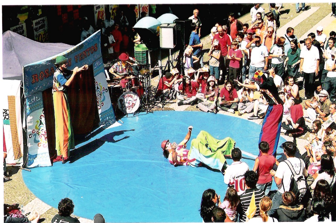
Foto 1 O espetáculo de rua do Festival Nacional de Teatro de Ponta Grossa (Fenata) deu uma pausa no fluxo incessante de pedestres no Calçadão da Coronel Cláudio, espaço de maior concentração de pessoas na região central da cidade. Picadeiro improvisado e perna de pau.

Percebe-se que o espetáculo de rua potencialmente ressignifica o espaço comum da cidade, principalmente ao criar situação (comunicacional) de contraste. Pessoas em roda formam a plateia que agora desafia as filas de quem segue ao trabalho, à escola, ao comércio ou vai para casa. As propagandas de produtos na janela do mercado defrontam-se com risos, músicas, danças, jogos, mitos e narrativas da cultura popular.