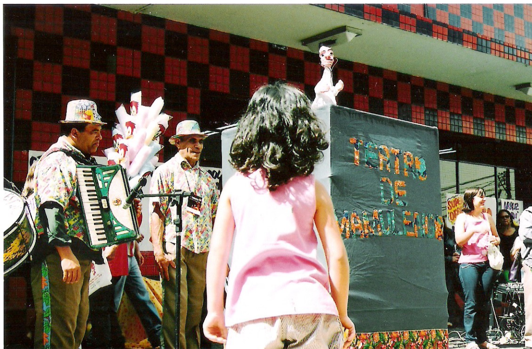
Foto 6 Criança responde às perguntas e às brincadeiras do boneco, na figura de um médico. O enredo inclui, ainda, outras figuras caras ao imaginário popular, como o coronel que tenta interromper o matrimônio e o 'coisa ruim' ou diabo.