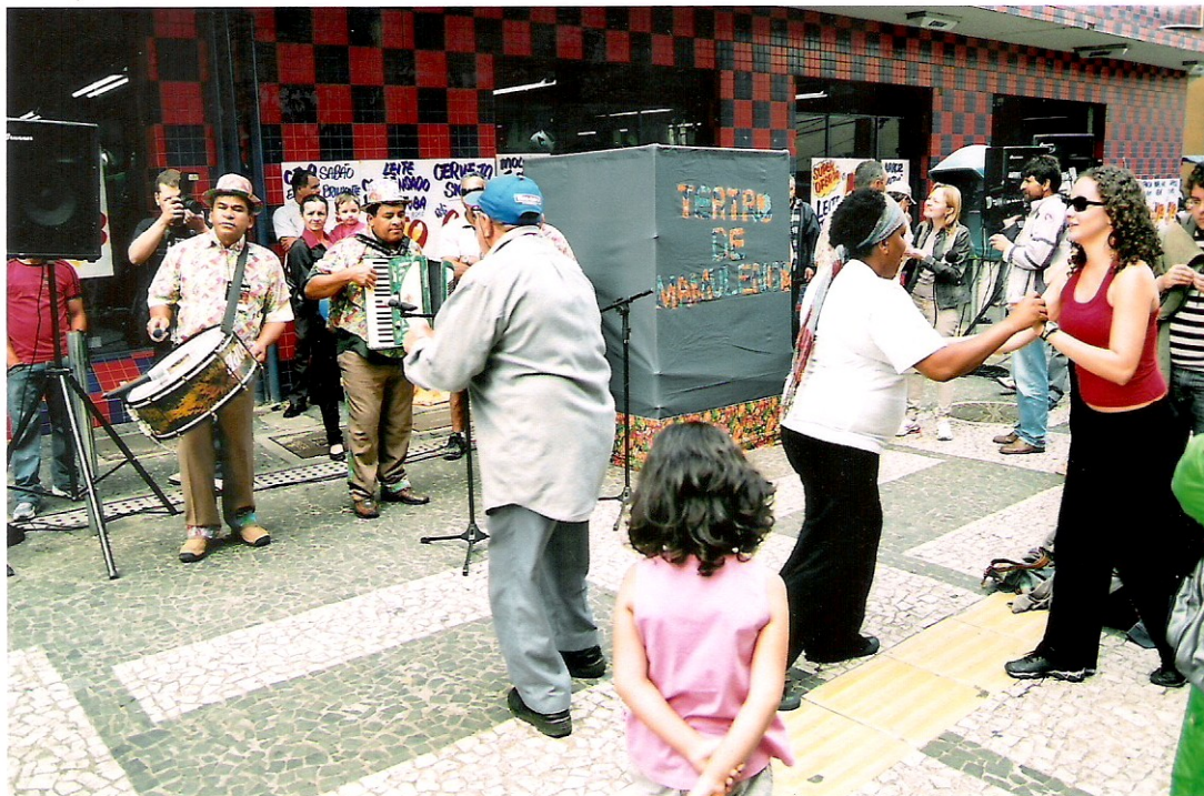
Foto 10 Ao fim do espetáculo de Teatro de Mamulengo, a plateia vira protagonista mais uma vez, entra no 'palco' e dança forró. O tom festivo dilui a distância entre artista e público, que ajuda a recriar o espaço teatral, simbólico, comunicacional e urbano.