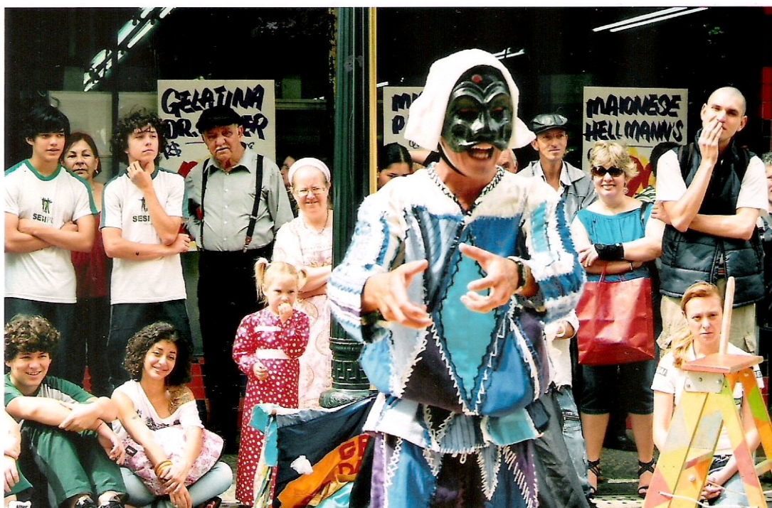
Foto 3 A mostra de rua proporciona contraste de faixa etária do público, mas também a diversidade étnica-cultural daqueles que foram ao Calçadão exclusivamente para ver o espetáculo, dos que estavam fazendo compras e de artistas de outras peças do Festival.