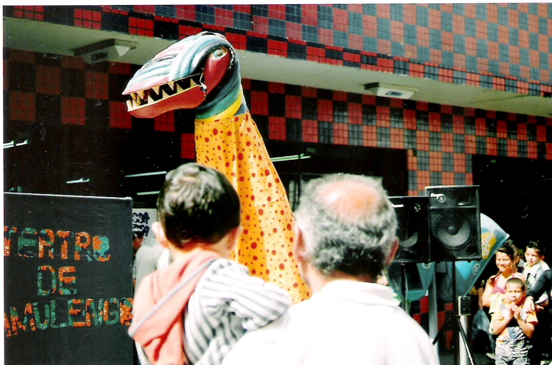
Foto 7 De forma inesperada, o mesmo ator que manuseia os bonecos dentro da caixa (à esquerda, na foto) esconde-se agora em fantasia que lembra alegorias carnavalescas de Olinda (PE). O monstro faz parte das narrativas míticas da cultura popular contadas às crianças.