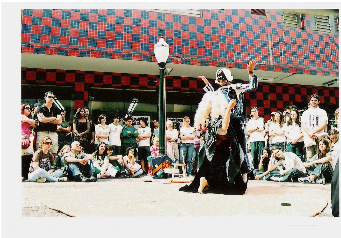
Foto 9 O ambiente urbano reconstitui o cenário do espetáculo de rua a cada apresentação. Uma parede colorida e um poste de luz da cidade agregam novos sentidos ao espetáculo, que por sua vez também altera temporariamente o Calçadão e as relações aí envolvidas.