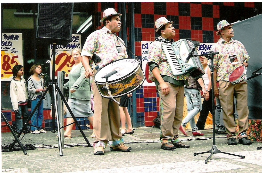
Foto 4 Ao fundo, diante da janela do mercado, crianças observam o desempenho de bonecos no Teatro de Mamulengo. O trio de músicos com zabumba, sanfona e pandeiro faz a sonorização do espetáculo a base de muito forró pé de serra.