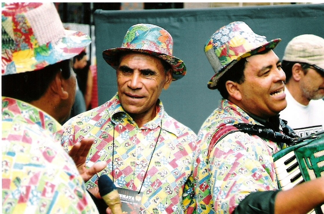
Foto 5 O trio é formado por dois pernambucanos e um paraibano. Os músicos interagem entre si durante o espetáculo e também com a plateia. O repertório inclui Luiz Gonzaga e outras referências do forró pé de serra.