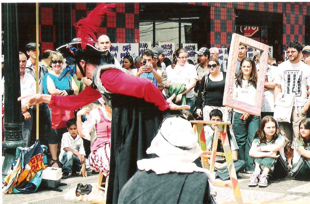
Foto 2 A disposição em roda do público ao redor da performance dos atores transforma a plateia em elemento cênico a compor o espetáculo. O público vê a peça mas também se vê e se encontra em função da opção cultural repentina.