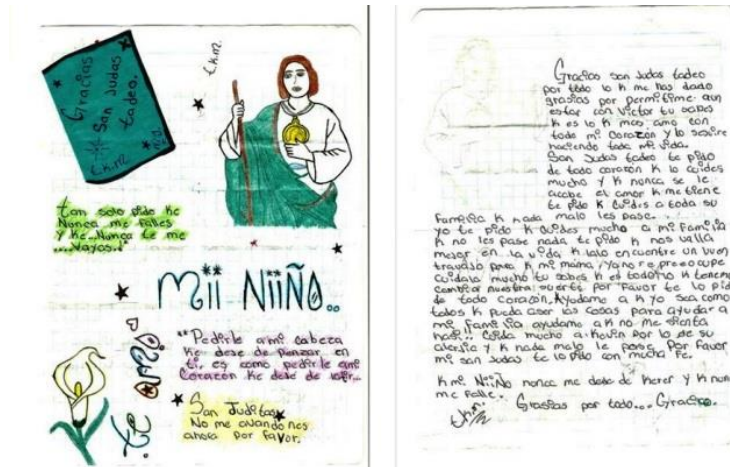
Figura 4. Carta ex-votiva em Senhor de Chalma, México.