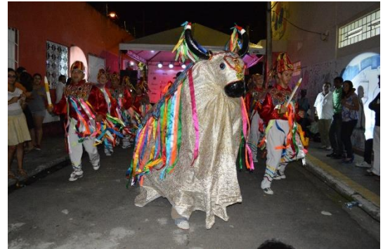
Fotografia n. 04: Figura do Boi na manifestação Boi Calemba Pintadinho. Natal, 2014.