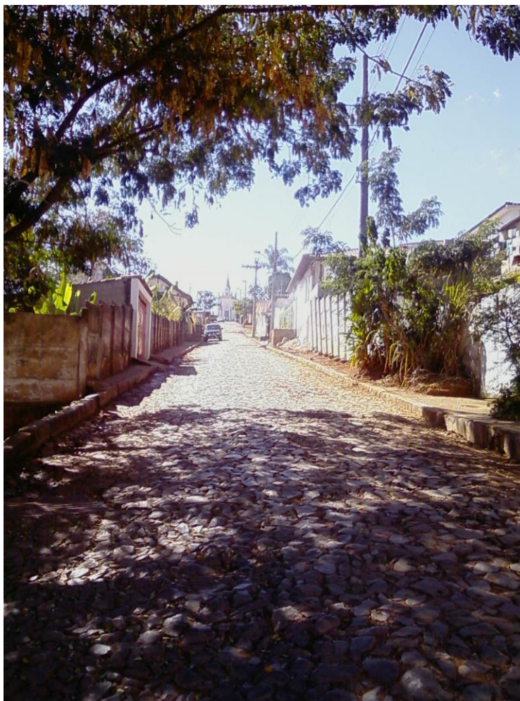
Foto 02: Avenida da Saudade: o caminho de pedras serranas ao cemitério do Serro