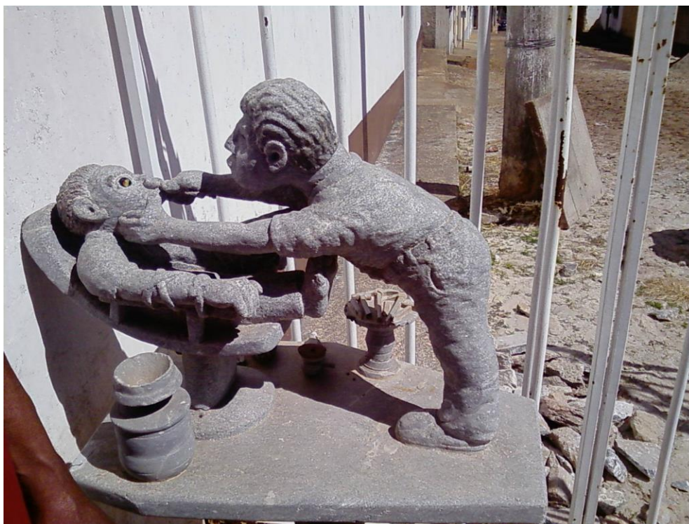
Foto 09: Um sorriso perdido em pedra, na ideia extraída e esculpida por José Dias