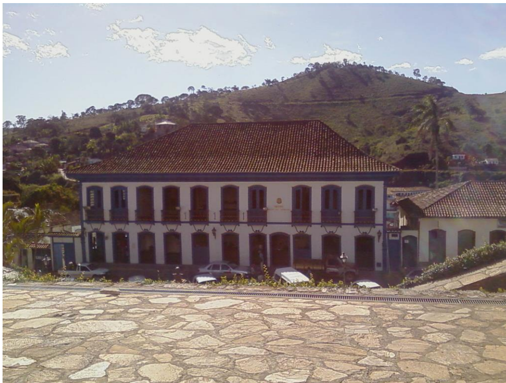
Foto 04: O poder e as pedras: entre a serra, a prefeitura do Serro