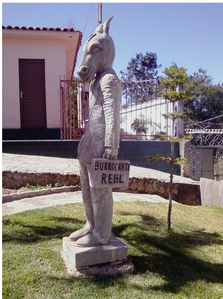
Foto 08: Em dias difíceis, as mãos que carregam a real burocracia. Escultura pelas mãos de José Dias