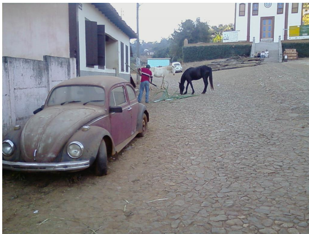
Foto 06: No pasto de pedras serranas, as quatro patas, as quatro rodas