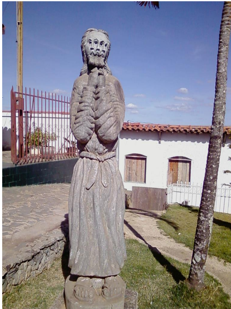
Foto 12: Pelas mãos de José Dias, um outro Jesus. Este por todos os lados