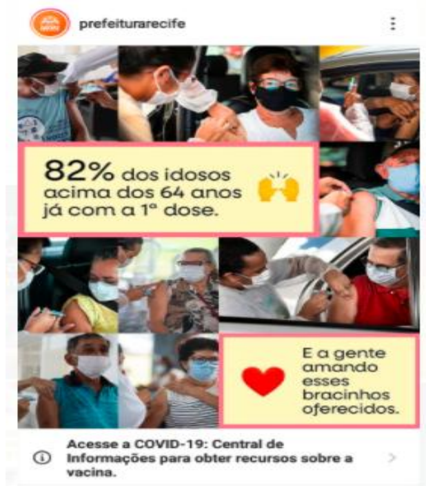
Figura 1 - postagem de 31 de Março