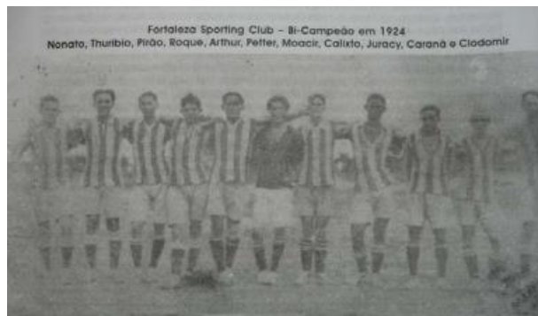
Figura 1 - Time do Fortaleza Sporting Club , bicampeão de 1924

Acontece que, o futebol surge no Brasil pautado por interesses de uma elite branca em um discurso que defendia a divisão de classe em seus aspectos econômicos e raciais. Para os nobres, a miscigenação e inserção das classes subalternas no futebol provocariam uma degeneração social. Entretanto, essas narrativas sofriam resistências e não eram aceitas em sua integralidade. Como podemos observar na figura 1, a “pluralidade” entre os jogadores no time do Fortaleza na década de 20. Detalhe para a grafia da marca do time na época: Sporting Club .