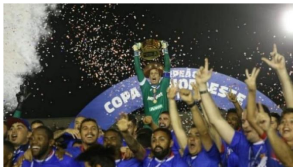
Figura 4 - Fortaleza Campeão do Nordeste 2019