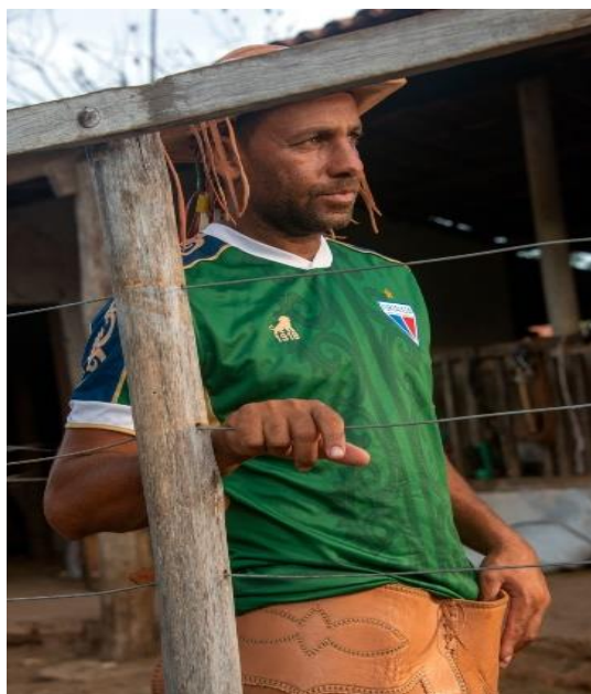
Figura 8 - No curral