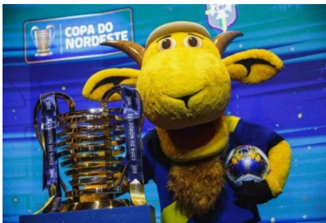
Figura 3 - Bode