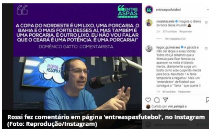
Figura 2 - Comentário de Rossi

A figura 2, nos mostra uma matéria publicada pelo site: lance.com.br, em que o jornalista, Domênico Gatto (2021, on-line ), da Rádio Energia 97 (SP), usa de um espaço midiático para propagar discursos xenofóbicos e preconceituosos sobre os times do Nordeste brasileiro. O jornalista menciona que: “A Copa do Nordeste é um lixo. Uma porcaria” (GATTO, 2021, on-line ). São falas com palavras depreciativas sobre os times nordestinos, em tom de desmerecimento por qualquer feito.