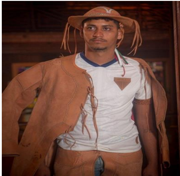
Figura 7 - O uniforme com o Gibão

Fortaleza E.C e, para finalizar, o artesão bate no peito, fala da exclusividade que o time tem com essa sua peça, ressaltando sua torcida, demonstrando todo o amor pelo clube.