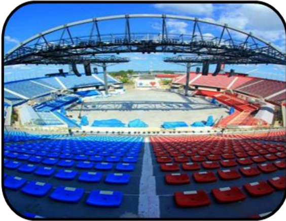
Visão do interior sem público