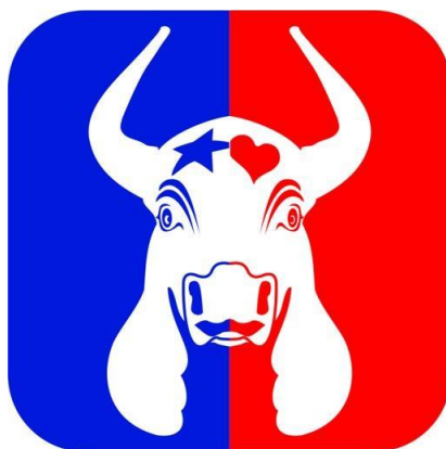
Figura 2 - Imagem combinando as cores e símbolos das duas agremiações do Festival: Caprichoso (azul, estrela) e Garantido (vermelho, coração)