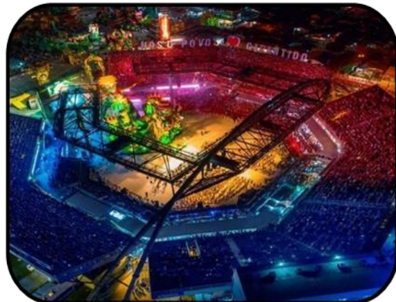
Visão Aérea com público