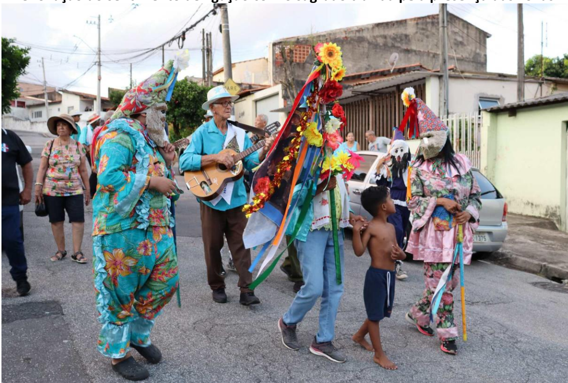
Foto 01: Foliões realizam o seu “giro” no bairro de Vila Formosa. No trajeto, cantam e se confraternizam com membros do grupo e moradores locais. Afinal, a sua existência está intimamente ligada a questões que perpassam ao sentimento de comunidade. A Folia de Reis depende das pessoas da comunidade, assim como essas pessoas dependem da renovação do sentimento de ligação com o sagrado trazida pela presença das Foliás.

seguida, acompanhamos o cortejo dos foliões no bairro de Vila Formosa de Sorocaba, que dá nome ao grupo de foliões “Companhia de Reis da Vila Formosa”, das 14h às 19h. Pretende-se, com este ensaio, apresentar a Folia de Reis sorocabana como manifestação comunicacional e popular que resiste ao tempo.