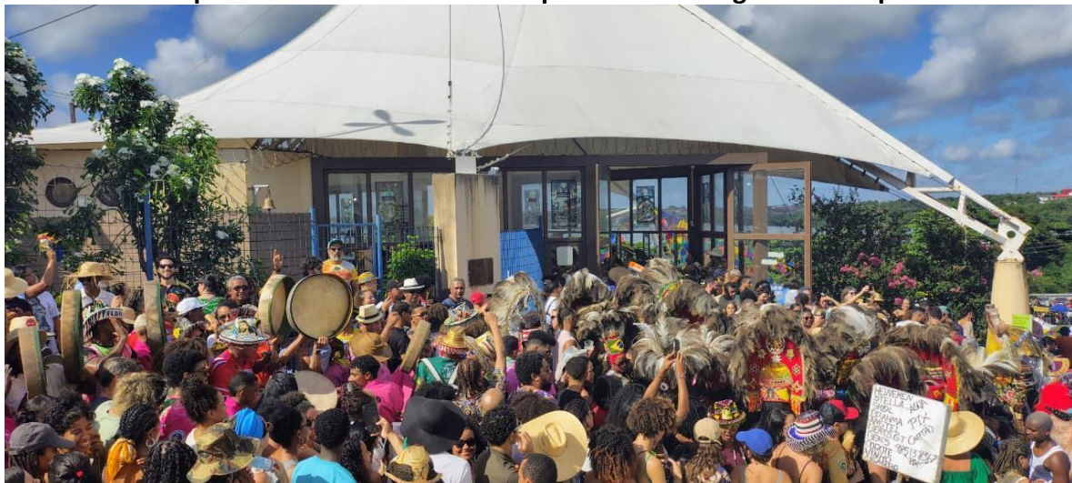
Foto 03: Grupo de Boi com brincantes e apreciadores chegando na capela S. Pedro