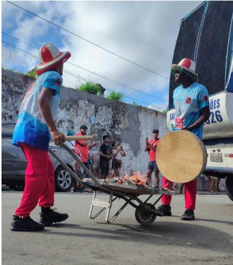
Foto 04: Brincantes do Boi transportando o fogo para aquecer os instrumentos