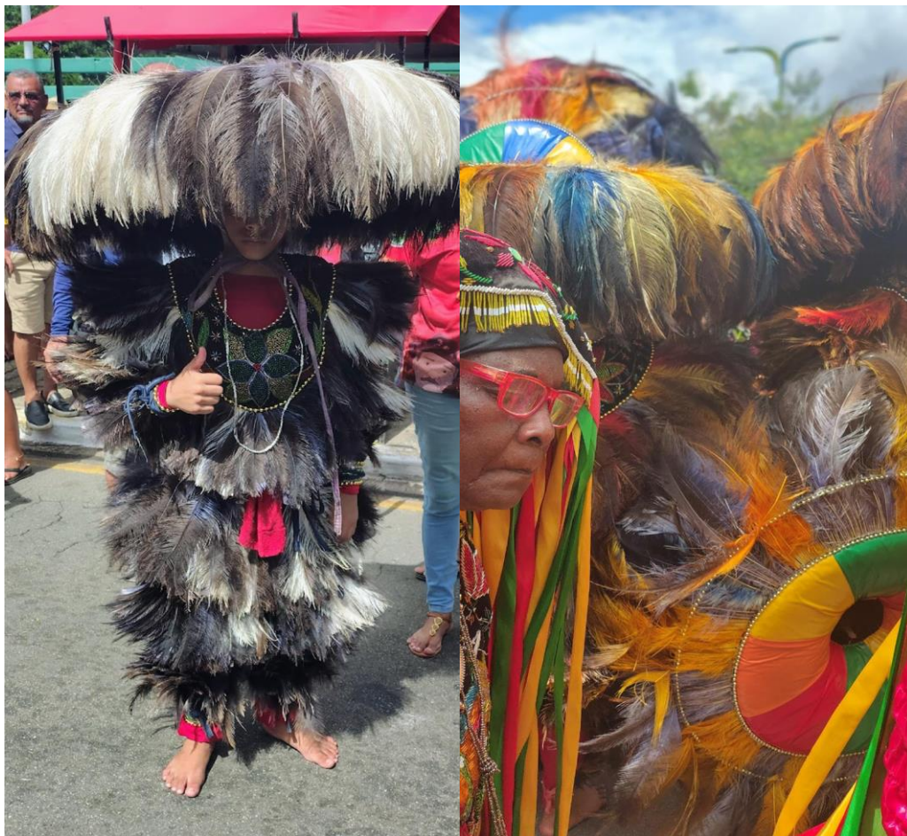
Foto 11: Gerações representando a continuidade do folguedo do Boi