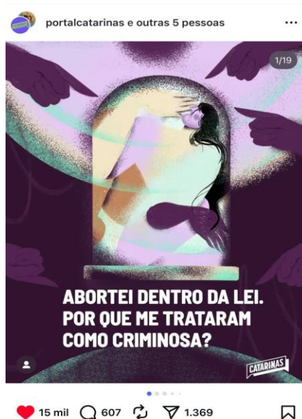
Figura 3 – Abortei dentro da lei. Por que me tratam como criminosa?