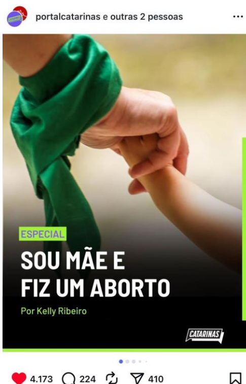
Figura 1 – Sou mãe e fiz um aborto