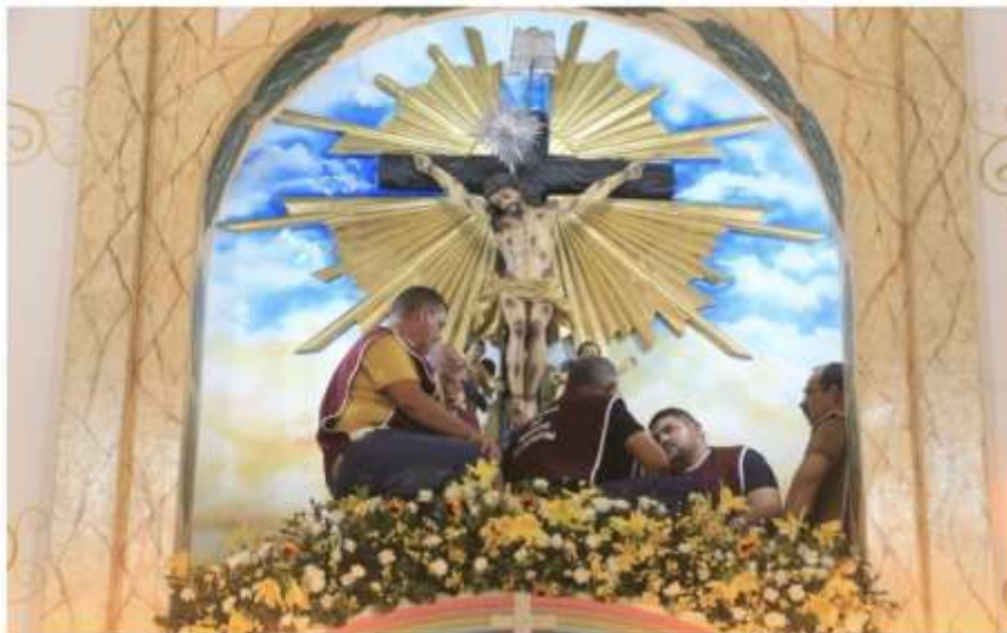
Figura 8 – Homens no altar-mor do Santuário do Senhor do Bonfim (2025)