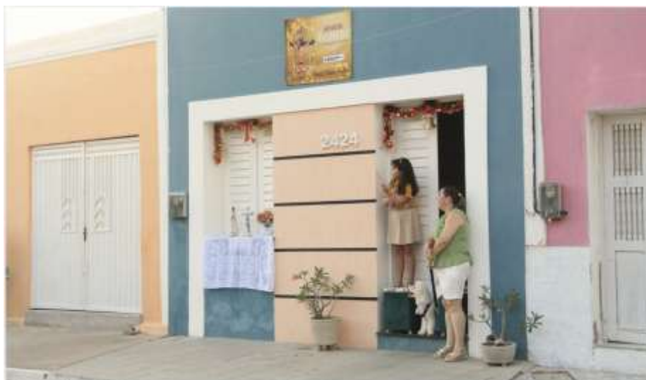
Figura 6 – Passagem da Procissão do Senhor do Bonfim (2026)