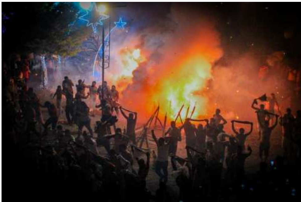
Figura 9 – Queima das bombas do Senhor do Bonfim (2026)