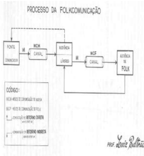
Figura 1 - Esquema do processo da Folkcomunicação

Diferentemente da comunicação de massa, que geralmente se utiliza dos canais hegemônicos, a Folkcomunicação se estrutura através da oralidade e da tradição popular, nas festas populares, nas músicas e nas narrativas em que podem se enquadrar as lendas. De acordo com Beltrão (2014), a Folkcomunicação também é importante na compreensão de como essas populações marginalizadas constroem e participam da vida social, mesmo sem acesso às mídias formais.