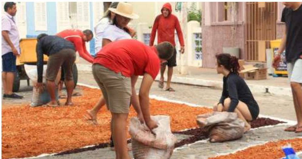
Figura 5 – Confeção dos tapetes do Senhor do Bonfim (2026)