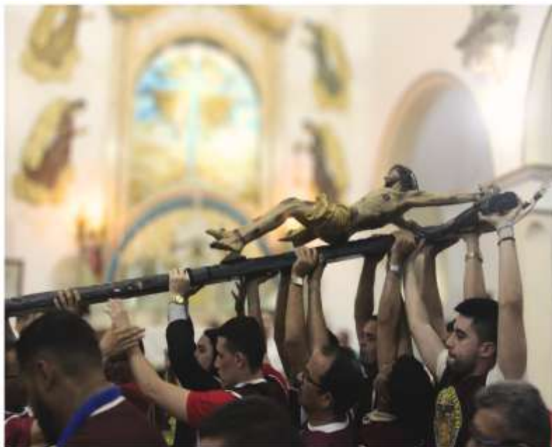
Figura 7 – Carregamento do Senhor do Bonfim (2024)