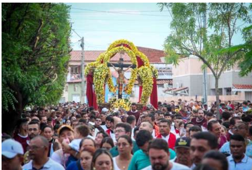
Figura 4 – Procissão do Senhor do Bonfim (2024)