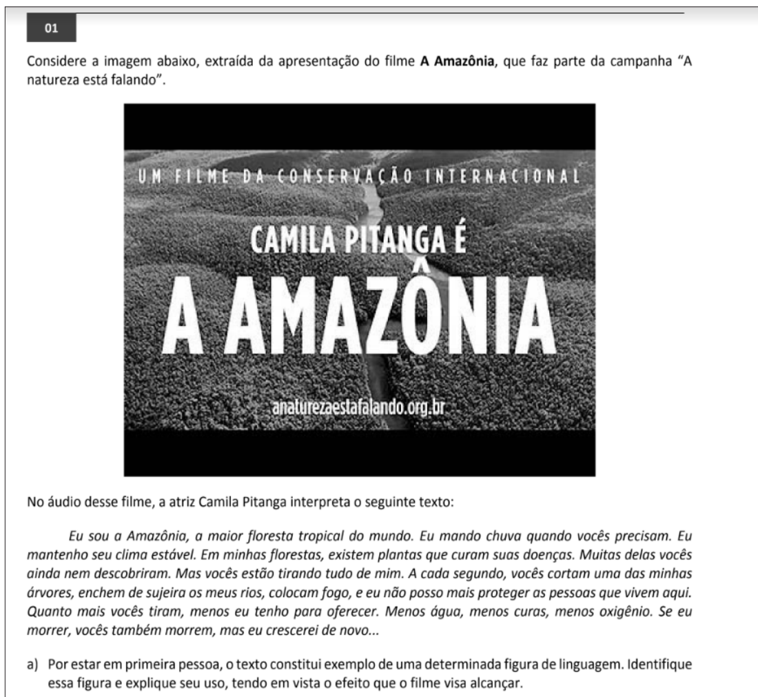
Figura 3: – Questão 1A, Fuvest, 2017