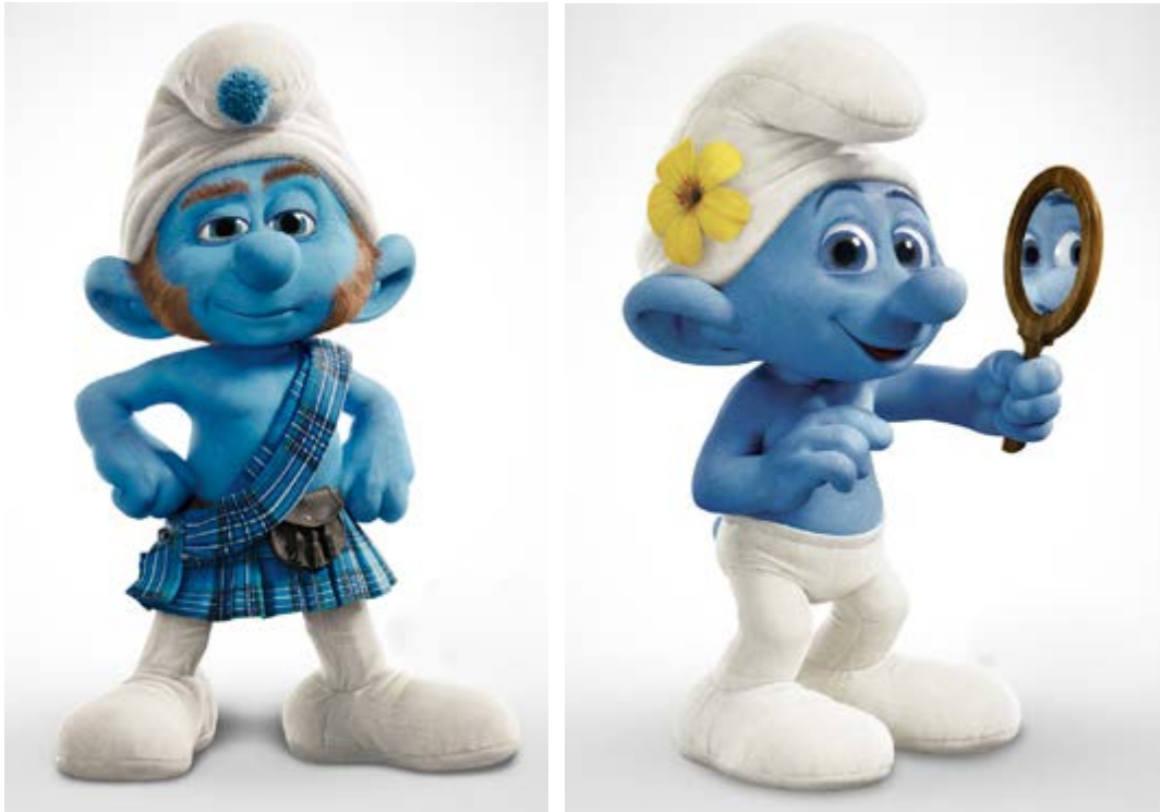
FIGURAS 1 E 2: PERSONAGENS VALENTE E VAIDOSO