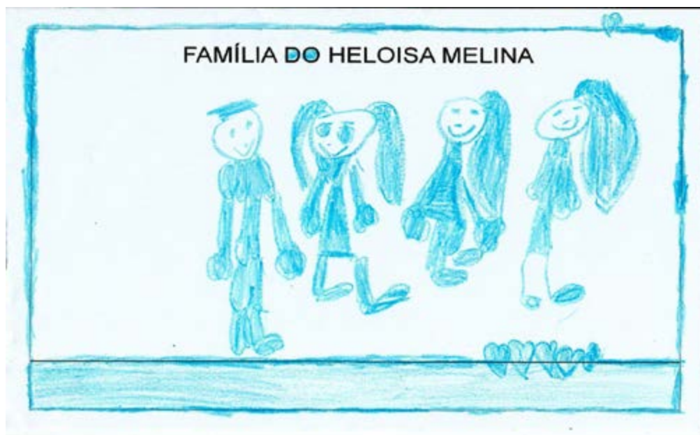
FIGURA 4: FAMÍLIA DE ALUNA DA EDUCAÇÃO INFANTIL.

Diante dessa ênfase dada ao corpo de Os Smurfs durante a leitura de imagens, propusemos às crianças uma atividade corporal, oralmente direcionada, a partir da qual elas puderam reconhecer e nomear as partes e estruturas de seus corpos e identificar diferenças e semelhanças entre si. Pedimos que tocassem e sentissem a cabeça, o tronco, os braços e as pernas, percebendo em que região estavam e quais eram os pontos de ligamento entre uma parte e outra. Consideramos que essa etapa de reconhecimento do esquema corporal foi importante para o desenvolvimento da atividade seguinte em que solicitamos às crianças que desenhasssem suas famílias. As composições foram feitas em papel branco e com giz de cera. Em referência aos personagens de Os Smurfs , os(as) alunos(as) foram orientados(as) a utilizarem gizes azuis para representar as partes dos corpos de seus e suas familiares, como pode ser examinado em um dos desenhos feitos pelas crianças (Figura 4).