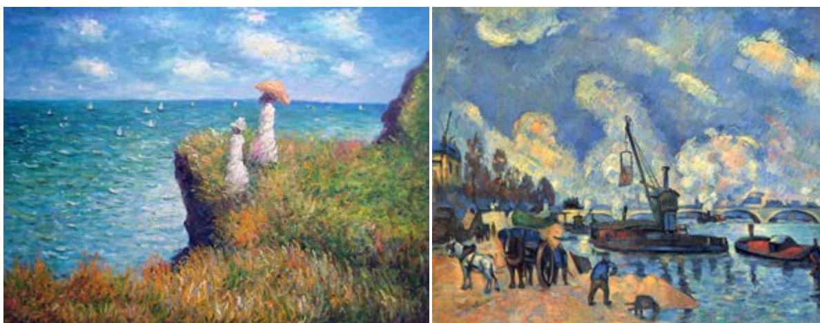
FIGURAS 5 E 6: CAMINHADA NO PENHASCO POURVILLE (1882), DE CLAUDE MONET; E O SENA EM BERCY (1876-78), DE PAUL CÉZANNE.