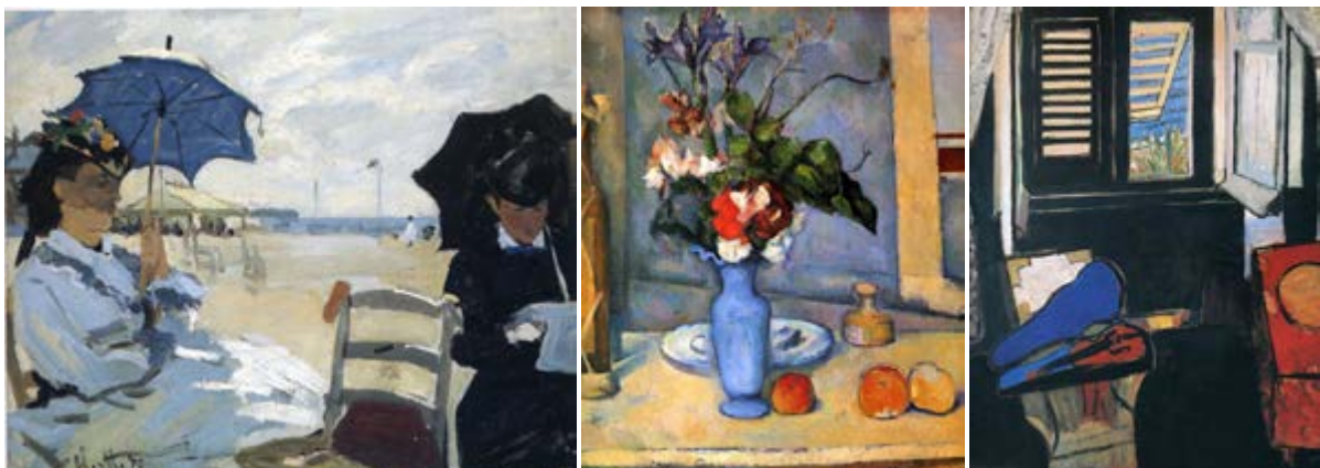
FIGURAS 11, 12 E 13: A PRAIA EM TROUVILLE (1870), DE CLAUDE MONET, NATUREZA MORTA COM VASO AZUL (1887), DE PAUL CÉZANNE, E INTERIOR COM UM VIOLINO (1918), DE HENRI MATISSE.