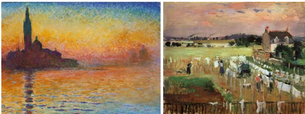
FIGURAS 7, 8 E 9: VENEZA AO PÔR DO SOL (1908-12), DE CLAUDE MONET; PENDURANDO A ROUPA PARA SECAR (1875), DE BERTHE MORISOT.