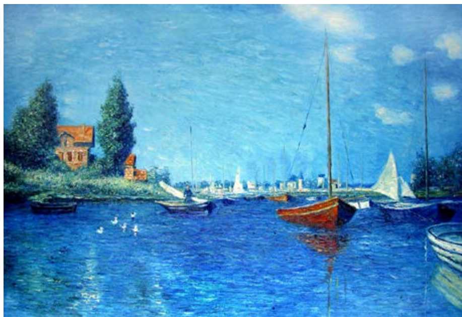
FIGURA 3: BARCOS VERMELHOS, ANGENTEUIL, DE CLAUDE MONET, 1875.