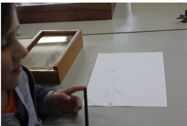
FIGURA 2: BICHO-PAU (SEM INTERVENÇÃO DO ADULTO)

A criança da imagem 1 optou por representar um inseto chamado Bicho-Pau. Por meio da observação, iniciou o seu desenho e o deu por finalizado, como pode ser verificado na figura 2.