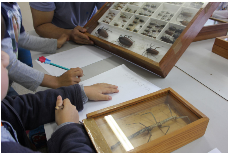
FIGURA 1: ESCOLHA DOS INSETOS