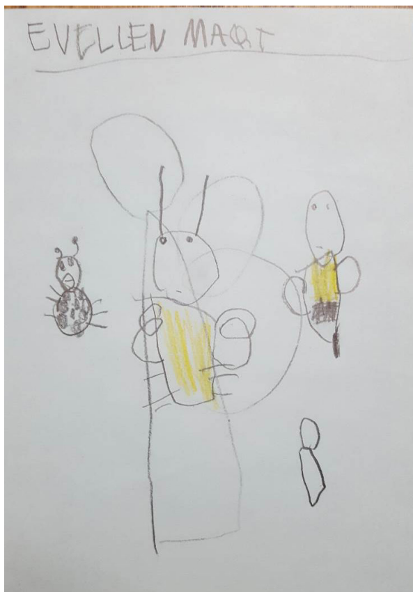
FIGURA 4: DESENHOS DE INSETOS