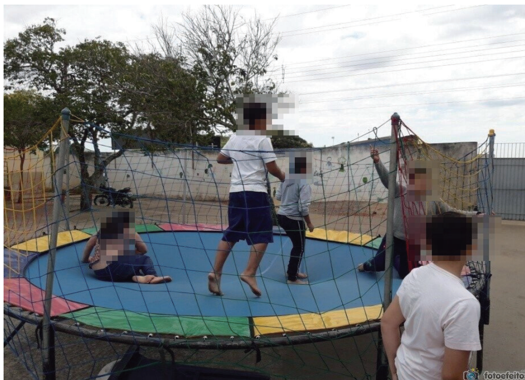
FIGURA 4 – CAMA ELÁSTICA.