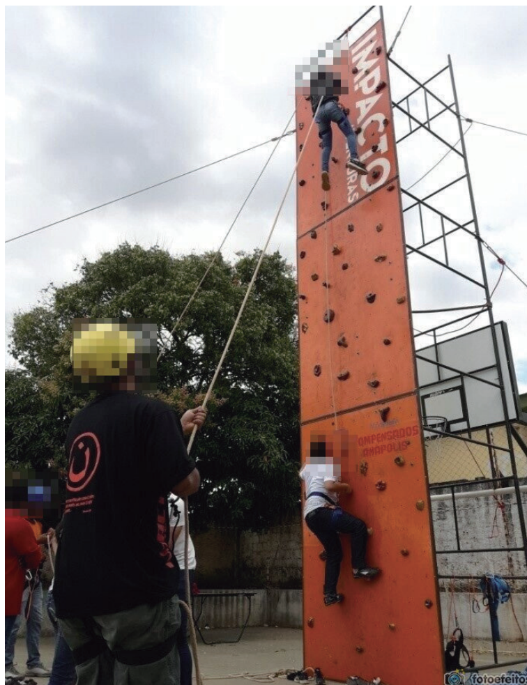
FIGURA 3 – ESCALADA NO PAREDÃO.