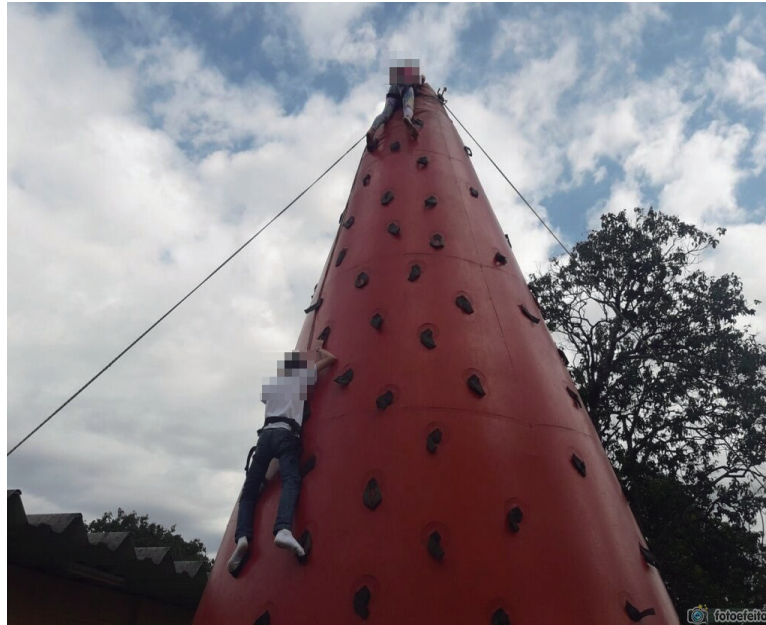
FIGURA 2 – ESCALADA NO MATERIAL INFLÁVEL.