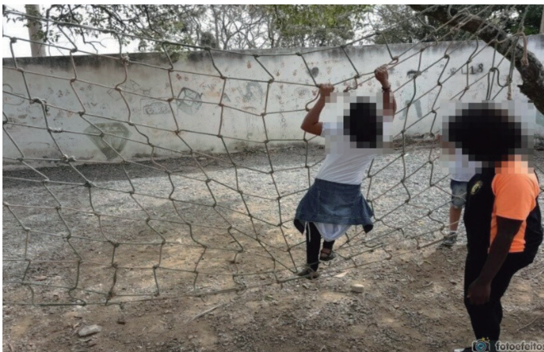
FIGURA 1 - ARVORISMO.

Nas figuras de um a quatro seguintes, podemos observar algumas imagens da experimentação das atividades de aventura feita pelos educandos.