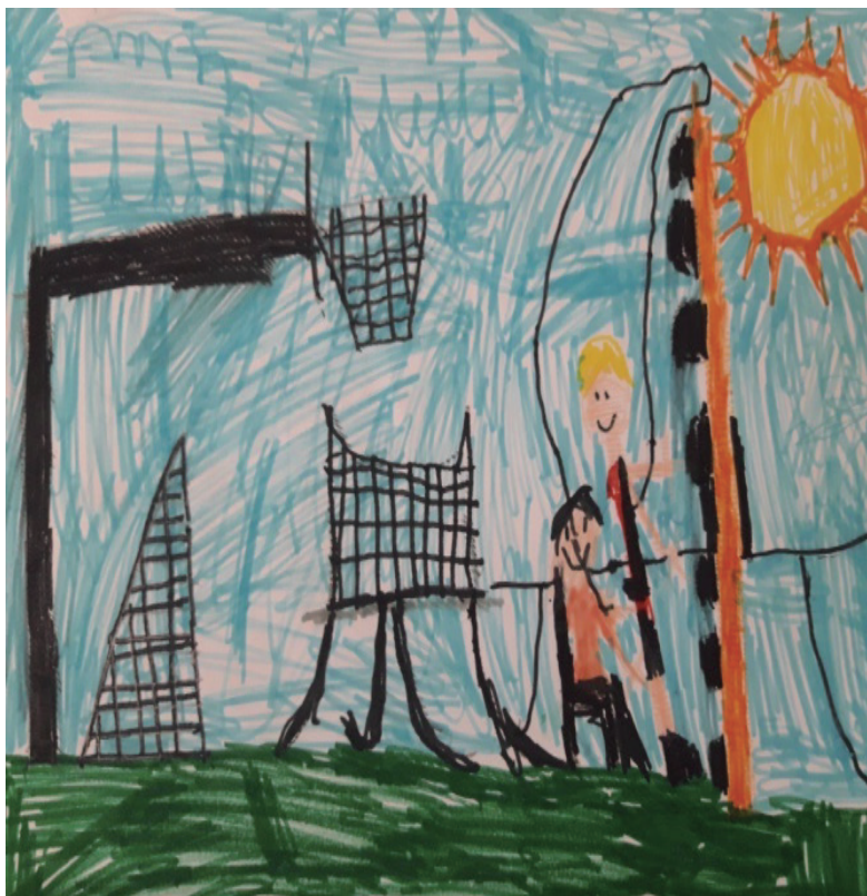
FIGURA 8 – DESENHO DO ALUNO DEFICIENTE VISUAL.