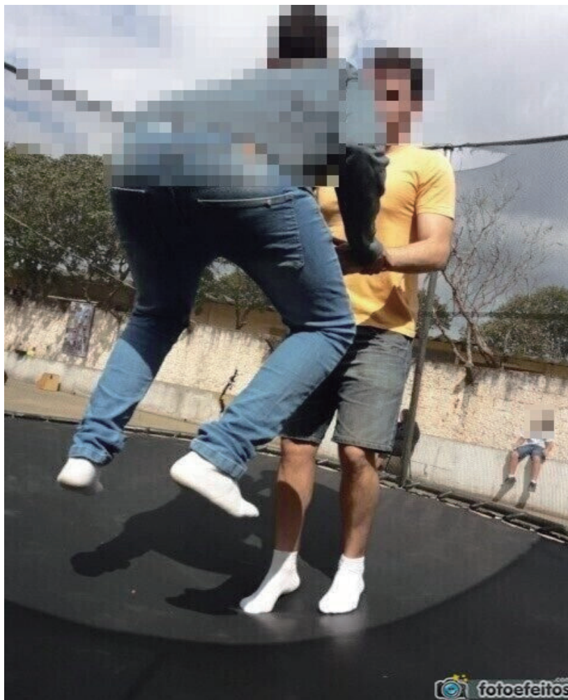
FIGURA 5 – ALUNO COM DEFICIÊNCIA INTELLECTUAL NA CAMA ELÁSTICA.

O aluno com deficiência intelectual também brincou muito na cama elástica e, da maneira como conseguiu, participou do arvorismo. Em todas as atividades ele foi acompanhado pelo seu professor de Educação Física e pela equipe da ONG. Constatamos que o aluno estava muito alegre com as novas e desafiadoras atividades. Seu corpo não foi esquecido e foi incluído, sendo respeitadas as suas especificidades, de tal forma que as atividades foram realizadas de forma mais devagar. Advertimos que não permitir que ele participasse da aula seria um absurdo e um ato de negação ao conhecimento e às descobertas do corpo e da vida.