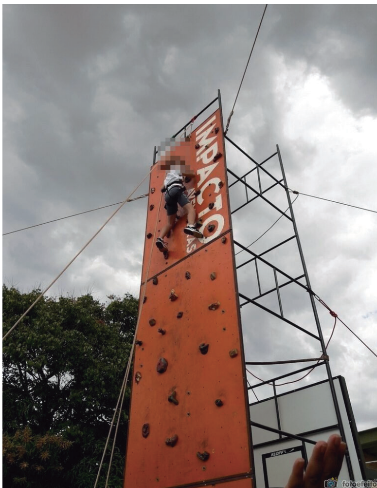
FIGURA 6 – ALUNO COM DEFICIÊNCIA VISUAL NA ESCALADA.

O estudante deficiente visual (cego de um olho e com baixa visão do outro) participou de todas as atividades e surpreendeu a todos quando chegou ao topo da escalada fixa. Ele demorou um pouco mais para completar a escalada, mas respeitamos o seu ritmo, sem cobrar que ele fosse rápido, como nos sugere Barreto e Reis (2011) ao nos alertar sobre o respeito aos ritmos particulares de aprendizagem de cada educando. Ele parou, sentiu medo, retornou a subir, até que venceu o paredão de aproximadamente 7,5 metros de altura, sendo que os professores e a equipe da ONG incentivaram o educando a não desistir, já que perceberam que ele conseguiria vencer o desafio dessa aventura. Na figura abaixo podemos constatar a conquista desse educando no paredão de escalada.