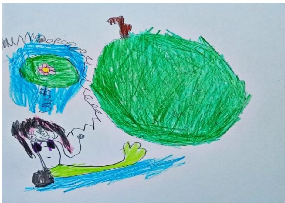
FIGURA 6 – Lendas: Yara e Vitória-régia