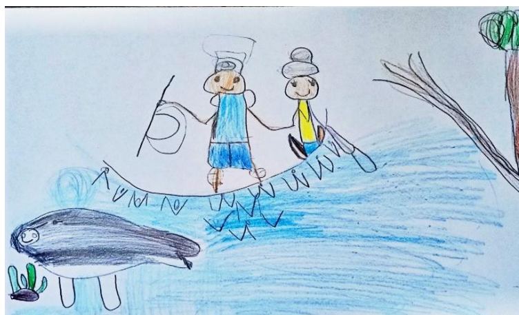
FIGURA 3 – Desenho de um casal ribeirinho pescando

A atividade transformou-se em um processo integrador de aprendizagens, no qual a oralidade, a leitura de mundo e a expressão artística se entrelaçaram. As produções infantis observadas, como no caso do desenho de um casal ribeirinho pescando (Figura 3), revelam a forte conexão das crianças com a vida comunitária.