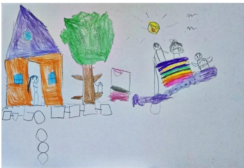
FIGURA 4 – Desenho sobre vivências de uma família amazonense

As representações gráficas, como o desenho sobre vivências de uma família amazonense (Figura 4), trazem à tona dimensões simbólicas da infância.