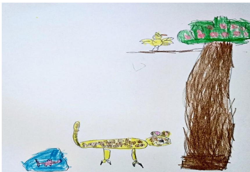
FIGURA 8 – Onça-pintada na floresta Amazônica

As experiências e produções criativas das crianças evidenciam que o desenho constitui um instrumento de encantamento, comunicação e expressão, articulado diretamente à realidade cultural e social, como percebido quando a criança faz menção à fauna amazônica (Figura 9), representando graficamente a onça pintada, espécie encontrada nas florestas locais e/ou nas comunidades do campo e beiras dos rios.