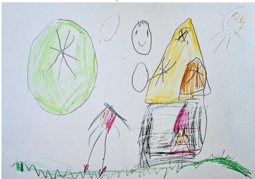
FIGURA 2 – Criança brincando no quintal