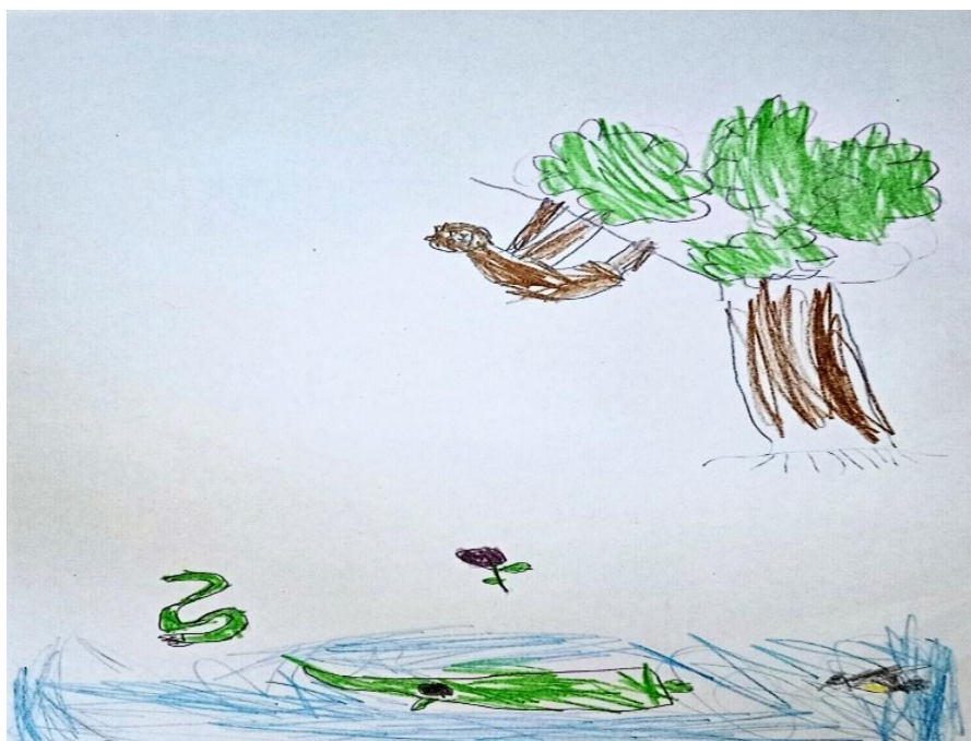
FIGURA 5 – Animais da Amazônia (preguiça, jacaré, cobra e peixe)

Cada linha, cor e textura remete às relações familiares, ao trabalho comunitário e às práticas culturais vivenciadas. Silva e Pasuch (2010) ressaltam que elementos como o rio, as árvores, os alimentos, os animais, as lendas, os rituais e as músicas não constituem apenas conteúdos escolares, mas cenários que estruturam e dão sentido à experiência infantil. Uma pedagogia que articula saberes culturais, imagens e expressão artística, rompe com a fragmentação do ensino. Esse processo possibilita à criança não apenas aprender, mas também reconhecer-se no universo cultural em que está inserida, legitimando sua voz e suas experiências. Em representações gráficas motivadas pelas literaturas amazonenses (Figuras 5 e 6), as crianças expressaram, de maneira vívida, animais da região e lendas como a da Yara e da Vitória-régia, evidenciando como o imaginário regional integra seus processos criativos.