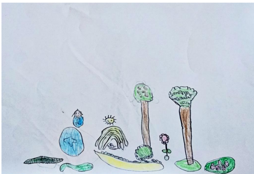
FIGURA 7 – Indígenas tomando banho de rio; a oca (ou maloca)

A inserção de temáticas amazônicas possibilitou às crianças compartilhar seus conhecimentos prévios sobre culturas indígenas, quilombolas e ribeirinhas, além da fauna e flora locais (Figura 7). Nessas interações, as crianças demonstraram não apenas reconhecer elementos de seu entorno, mas também estabelecer relações entre suas vivências e os conteúdos escolares.