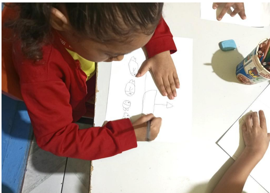
FIGURA 1 – Criança desenhando na sala de aula – Escola Gavião Real

De modo geral, os desenhos propostos nas atividades escolares ainda não se apresentam de forma planejada e integrada ao contexto amazônico, permanecendo frequentemente como práticas pontuais. Tal lacuna, entretanto, é em parte suprida pela própria iniciativa infantil: quando solicitadas a desenhar, as crianças espontaneamente representam barcos, plantas, canoas e pássaros, reafirmando seu vínculo cultural com os territórios amazônicos.