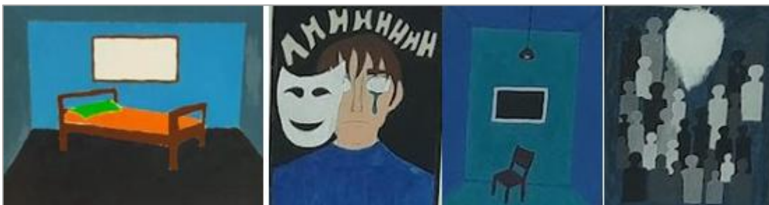
FIGURA 13 - Trabalhos dos estudantes exploram o tema "Narrativas do Deserto", associando-o a experiências pessoais e coletivas de resiliência.

A temática foi aprofundada por meio de interpretações simbólicas que associam o deserto a processos de transformação e resiliência. Para além da representação de elementos como camelos e lhamas, os estudantes das séries finais exploraram, de forma poética e crítica, as múltiplas dimensões desse ambiente, articulando suas produções a experiências pessoais e coletivas. Esse movimento evidencia a capacidade da prática artística de operar como mediação entre imaginário, subjetividade e realidade, ampliando as possibilidades de significação no contexto educativo.