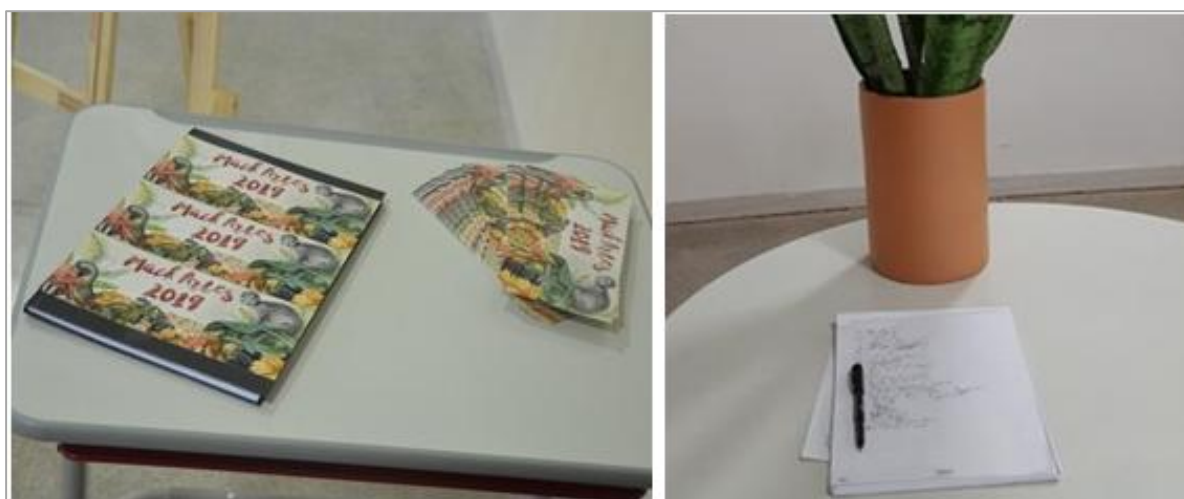
Figura 8 - Livros de registro de presença com comentários dos visitantes