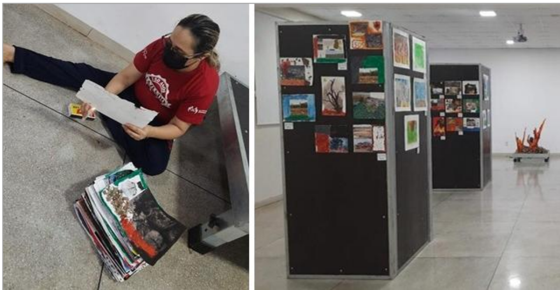
FIGURA 11 - O projeto da Mostra de Arte incentiva o uso de diferentes materiais, como as colagens criadas pelos alunos com imagens impressas e elementos orgânicos.