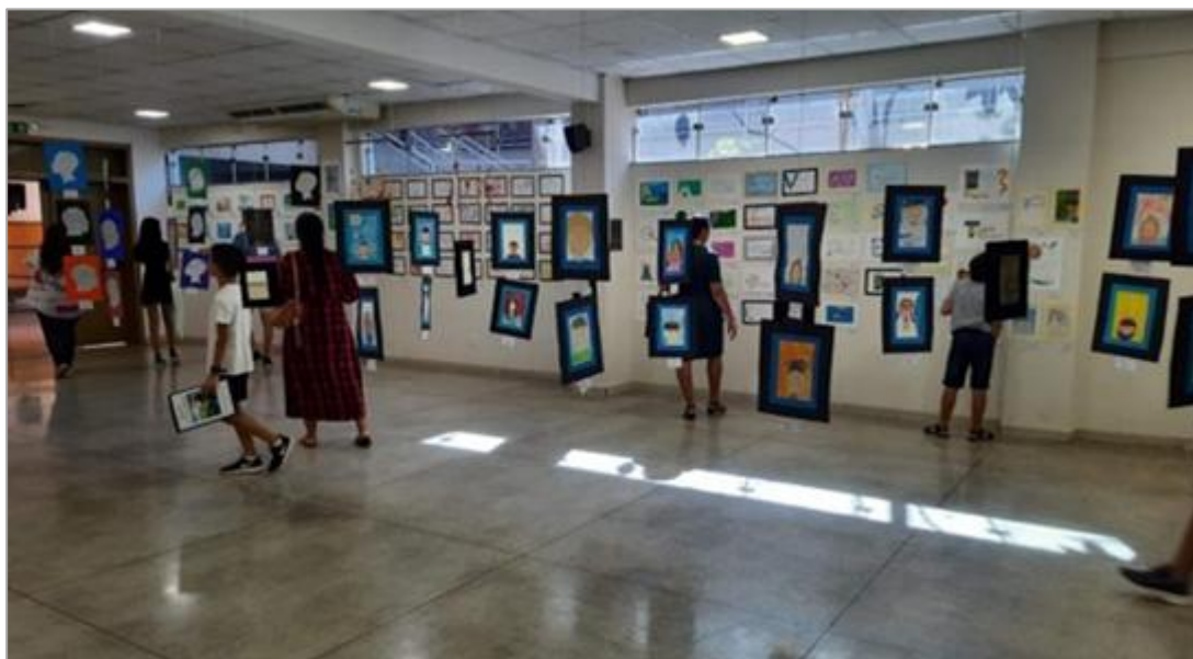
FIGURA 15 – Alunos e familiares em um momento de fruição estética e cultural, explorando livremente a galeria.

Em determinadas edições, a Mostra assume caráter interativo ao convidar o público a participar de atividades artísticas, o que potencializa o engajamento dos visitantes e amplia as possibilidades de aprendizagem estética e cultural. Sob a perspectiva da experiência estética (Eisner, 2008, 2013), essa participação ativa favorece a construção de significados, na medida em que os sujeitos deixam de ocupar uma posição exclusivamente contemplativa e passam a atuar como coautores da experiência. Ademais, tal dinâmica dialoga com o conceito de letramento estético (Araújo, 2021), ao promover práticas de leitura, produção e interpretação de sentidos em contextos compartilhados, fortalecendo a dimensão social da arte e da educação.