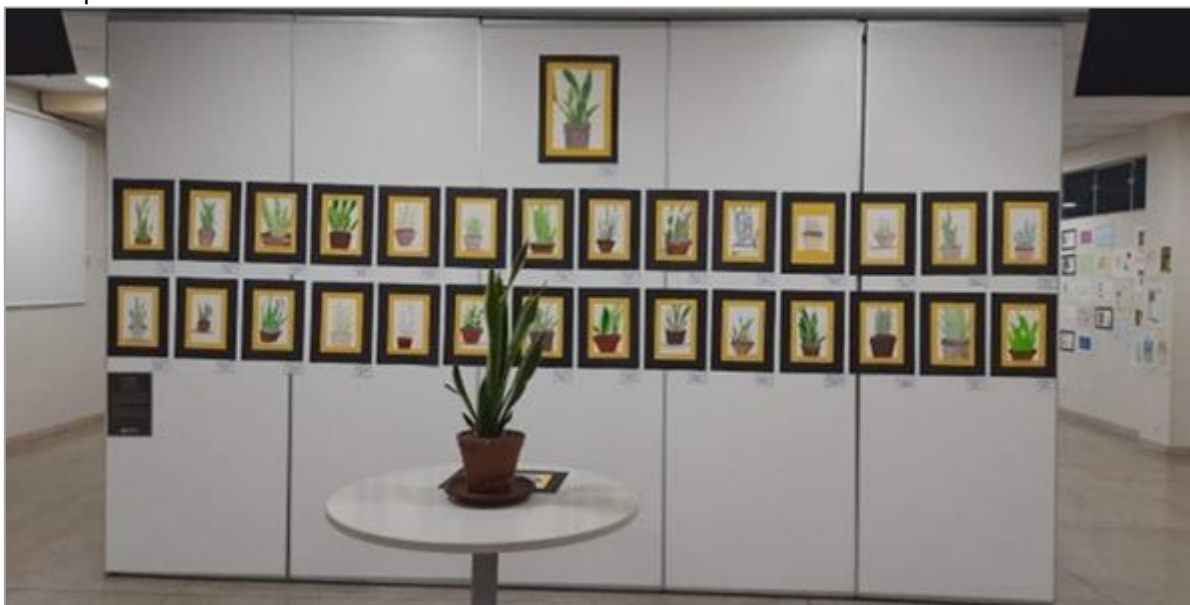
FIGURA 1 – Vista da Mostra de Arte 'Materialidades' (2023), com destaque para a ambientação expositiva.

Na sequência, apresentam-se imagens referentes à pesquisa de campo realizada, com o objetivo de ilustrar o processo de organização e execução da Mostra de Arte. As imagens são de autoria dos próprios pesquisadores.