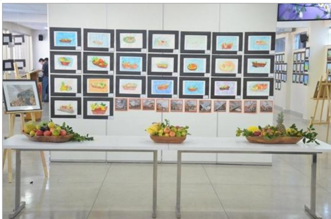
FIGURA 3 – Vista da Mostra de Arte 'IDENTIDADE! Mostre a sua' (2022), com destaque para a diversidade de produções.