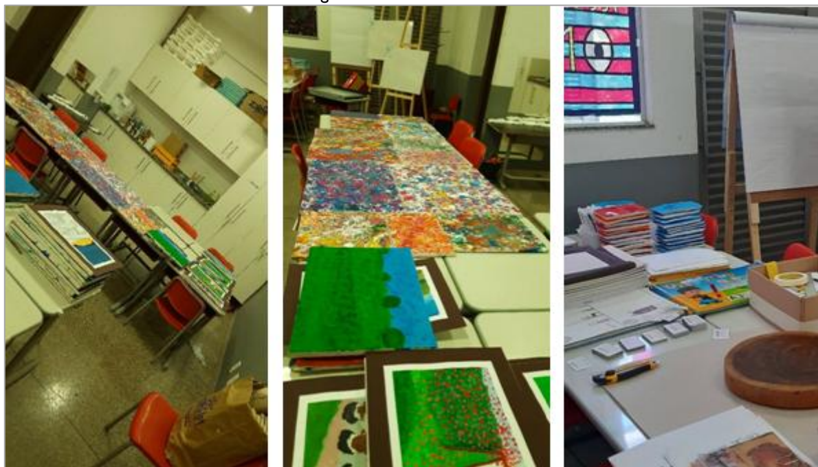
FIGURA 4 - Detalhe da curadoria e montagem técnica das obras.