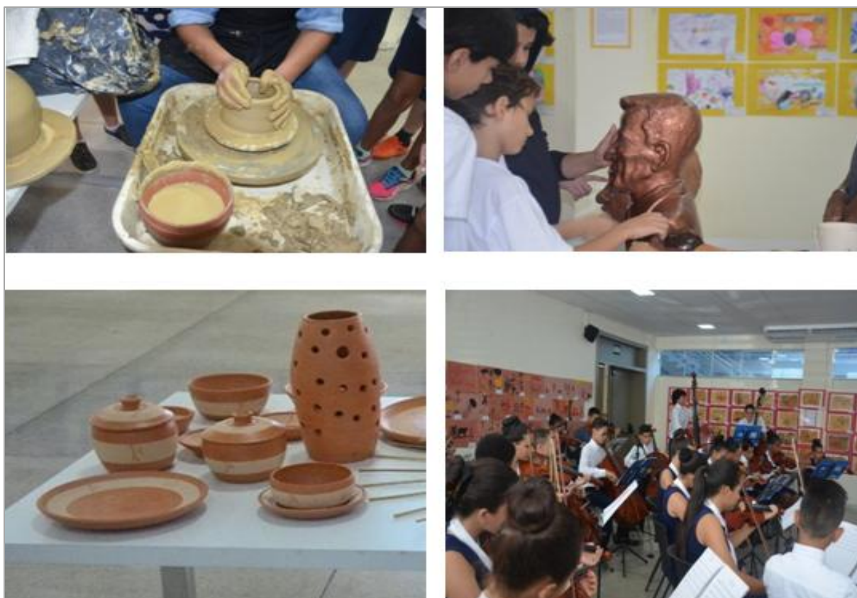
Figura 7 - A Mostra de Arte oferece experiências interativas, como a demonstração de cerâmica ao vivo e a mediação de alunos com a escultura.