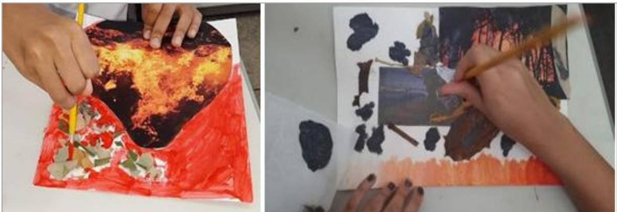
FIGURA 10 - O projeto une o processo criativo e o resultado final da obra para abordar a problemática das queimadas. À esquerda, detalhe do processo de aplicação de tinta nas colagens; à direita, a escultura exposta na galeria com a projeção das queimadas ao fundo.

Além da escultura, os estudantes desenvolveram colagens utilizando imagens impressas, materiais orgânicos e tinta, representando visualmente os efeitos das queimadas. A professora mediou o processo criativo e realizou o acabamento das obras, queimando cuidadosamente as bordas das colagens para reforçar a temática.