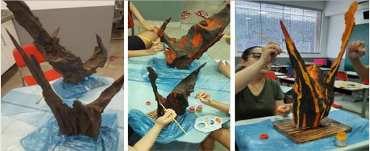
FIGURA 9 - O processo criativo na Mostra de Arte, com a colaboração entre alunas e professora na produção de uma escultura inspirada em Frans Krajcberg