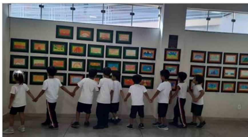
FIGURA 14 – ALUNOS DURANTE UMA VISITA GUIADA À EXPOSIÇÃO.

A fruição artística, nesse contexto, configura-se como dimensão central da experiência educativa, ao proporcionar momentos de contemplação, introspecção e deslocamento da rotina escolar. Conforme apontam Rodrigues, Wilhem e Chaud (2018), tais experiências ampliam o potencial formativo da educação ao articular sensibilidade, percepção e construção de sentidos. Ademais, a Mostra favorece o diálogo interdisciplinar, evidenciado pela participação de professores de outras áreas na organização de visitas guiadas, o que amplia as possibilidades de leitura das obras e reforça a integração entre diferentes campos do conhecimento.