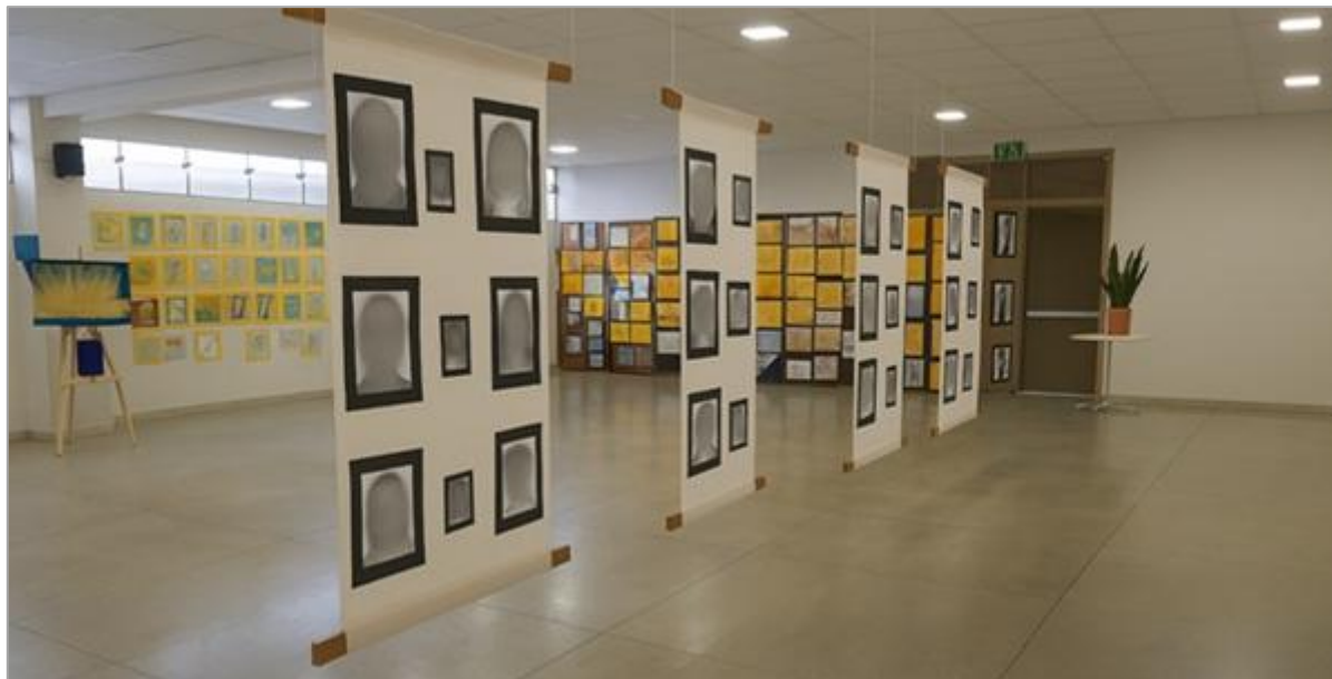
FIGURA 2 – Vista da Mostra de Arte 'IDENTIDADE! Mostre a sua' (2022), com destaque para a diversidade de produções.