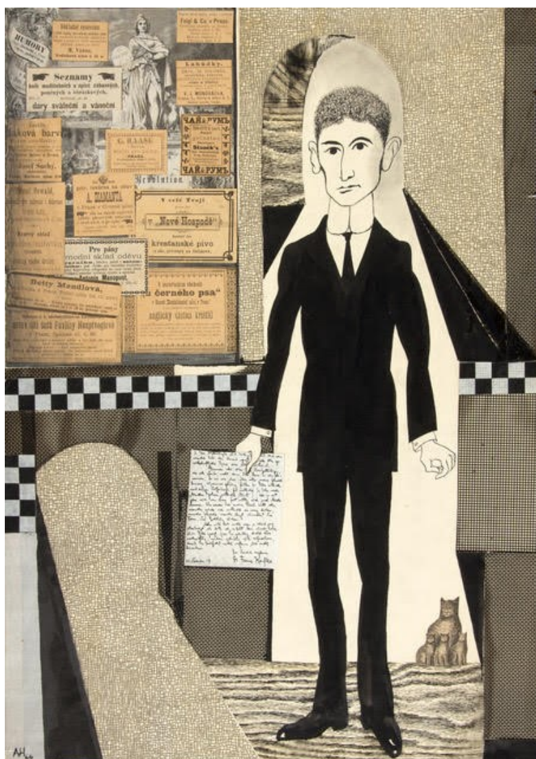
Adolf Hoffmeister, Franz Kafka, 1966

Mais próximo do sentido político da sociologia das profissões, em que designa a forma de organização das profissões liberais que têm sua autonomia “técnica” e organizacional (controle dos recrutamentos e das práticas) reconhecida pelo Estado (Item 1.1), o conceito de autonomia na tradição marxista constitui uma correção à teoria que vê nas obras de arte, assim como na religião e no Estado, uma superestrutura que reflete as relações sociais de produção (Item 1.2), enquanto na teoria dos campos se trata de uma autonomia (relativa) dos universos de produção em relação às restrições externas, políticas, religiosas e econômicas (Item 1.3).