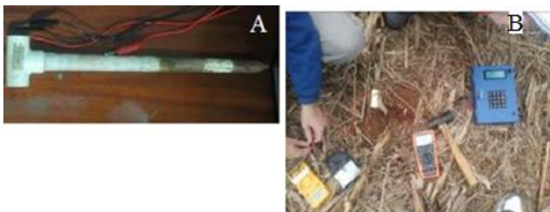
Figura 1 – (A) “Sensor haste”. (B) - Análise da terra.

A coleta dos dados da pesquisa foi realizada em uma gleba da Fazenda Capão da Onça, pertencente à Universidade Estadual de Ponta Grossa, localizada na região dos Campos Gerais, no município de Ponta Grossa, no estado do Paraná. Para realizar as medidas de resistência elétrica do solo, foi utilizado um sensor desenvolvido por Celinski (2008), este sensor é composto por uma haste de PVC com terminais em cobre (Figura 1A). A resistência elétrica foi primeiramente medida com um multímetro analógico Marca F&M, e logo em seguida foi realizada a medida da resistência elétrica com o arduino. Na figura 1B observamos os sensores no solo e os instrumentos de medidas realizando as coletas dos dados o microcontrolador encontra-se dentro do case (azul).