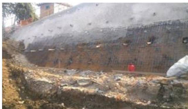
Figura 08 – Dreno tipo Barbacã.

O tipo de dreno utilizado neste projeto é do tipo barbacã (Figura 08). O sistema de barbacã se caracteriza por se localizar nas proximidades da face do revestimento, não se aprofundando muito ao solo. O dreno empregado formado por um tubo de plástico de 75mm com pequenas perfurações na parte onde ficará dentro do solo, essas perfurações são envoltas por uma primeira manta bem fina e posteriormente colocado aproximadamente 20 litros de pedra brita do tipo 1 e por fim uma segunda manta geotêxtil para separar a pedra brita do solo.