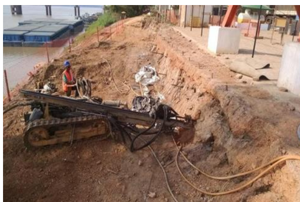
Figura 06 – Perfuração das bainhas.

O processo de perfuração das bainhas para acomodar os grampos foi realizado por meio dos equipamentos de ar comprimido, conforme mostrado na Figura 06. Sendo utilizado brocas com diâmetro de 100mm. Este método de perfuração foi adotado, pois garantiu a estabilidade da cavidade até as etapas finais da bainha.