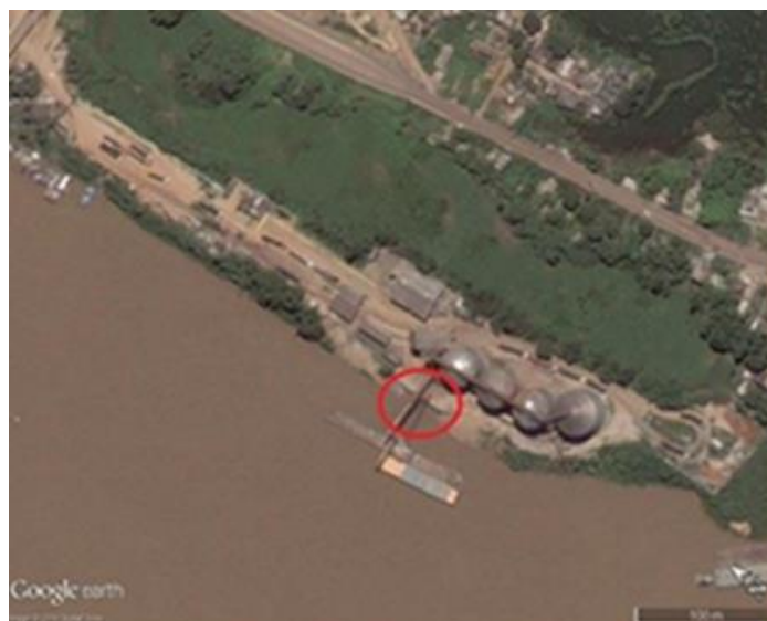
Figura 01 – Local a ser recuperado, via imagem de satélite ( Google Earth ).

A área de estudo corresponde a uma encosta em processo de instabilidade localizada no bairro Panair, no município de Porto Velho/RO. Acima da crista da encosta existe a empresa do ramo alimentício, cuja atividade é a produção e o processamento de alimentos. A Figura 01 a imagem de satélite do local.