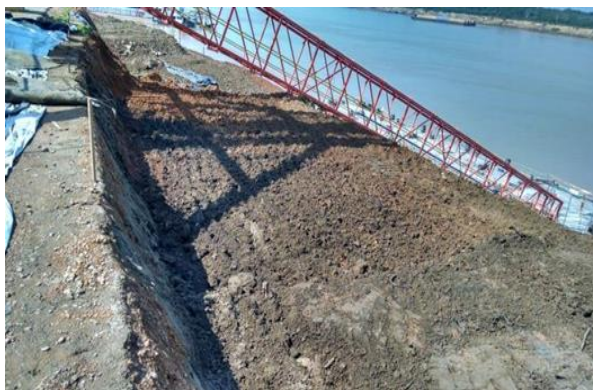
Figura 5 – Corte da camada superficial.