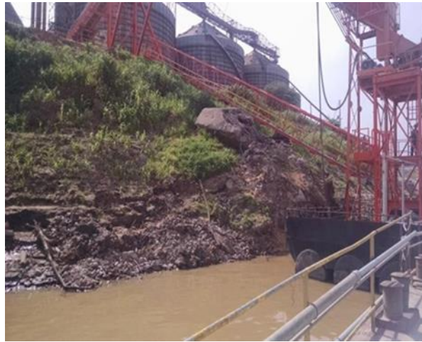
Figura 02 – Detalhe da encosta antes do início dos trabalhos.

toneladas de grãos da citada empresa (Figura 02).