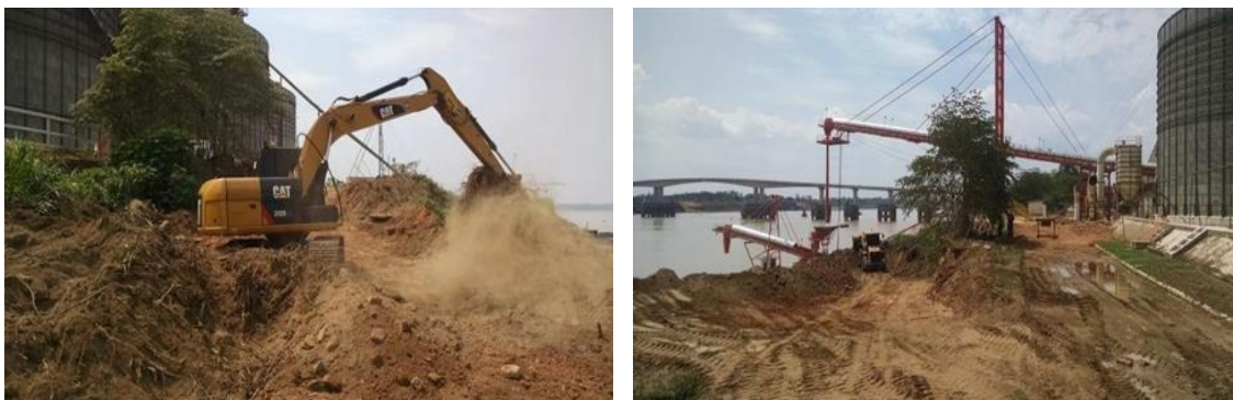
Figura 03 – Processo de limpeza do local.

Com objetivo de evitar o acúmulo de água no local de recuperação, bem como os problemas de infiltrações que motivam a saturação do solo e, conseqüentemente, a perda de funcionalidade da estrutura. Fez-se a proteção superficial da crista do talude por meio de valetas de concreto (Figura 04), o sistema construtivo possui uma declividade que possibilita o escoamento rápido e seguro da água pluvial na caixa de passagem.