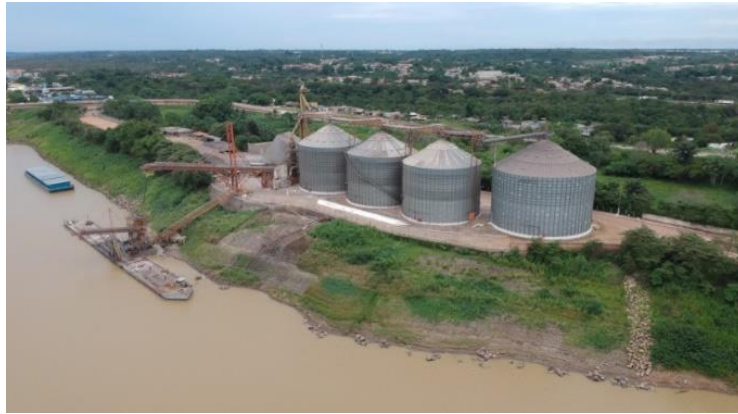
Figura 10 – Talude concluído.