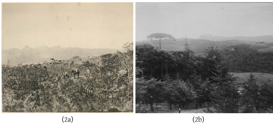
Figura 2: Paisagens do relevo brasileiro: (2a) Cerrado do Planalto Central; (2b) marres de morro e araucária do Planalto Atlântico. 54

A atuação política de Jaguaribe se resumia a defender a autonomia dos municípios e a criar núcleos moderados pela cessão das terras devolutas da