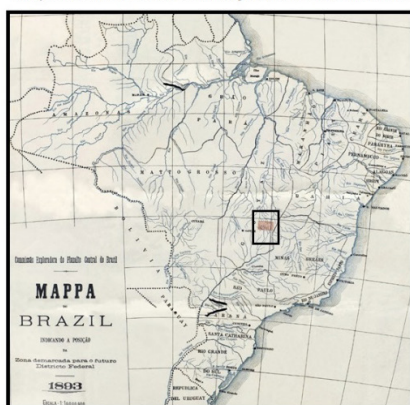
Mapa do Brasil, com a delimitação da área do futuro DF

“Retângulo Cruls”, indicando o futuro DF, e os itinerários