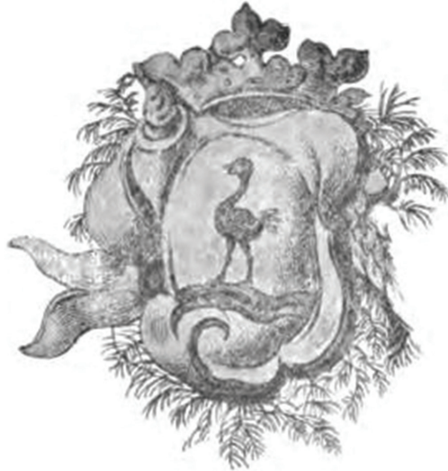
Figura 1 – Brasão da Capitania do Rio Grande

Fonte: CARVALHO, Alfredo de. “Os Brasões d’Armas do Brasil Holandês”. Revista do Instituto Archeologico e Geographico Pernambucano , Recife, v. XI, n. 61, p. 574-589, mar. 1904.