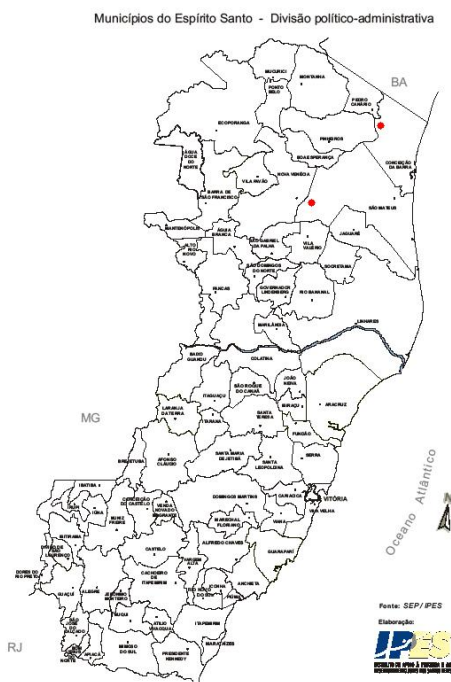
Mapa 2: Assentamentos Rurais pesquisados