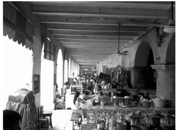
Mercado 5 de Septiembre