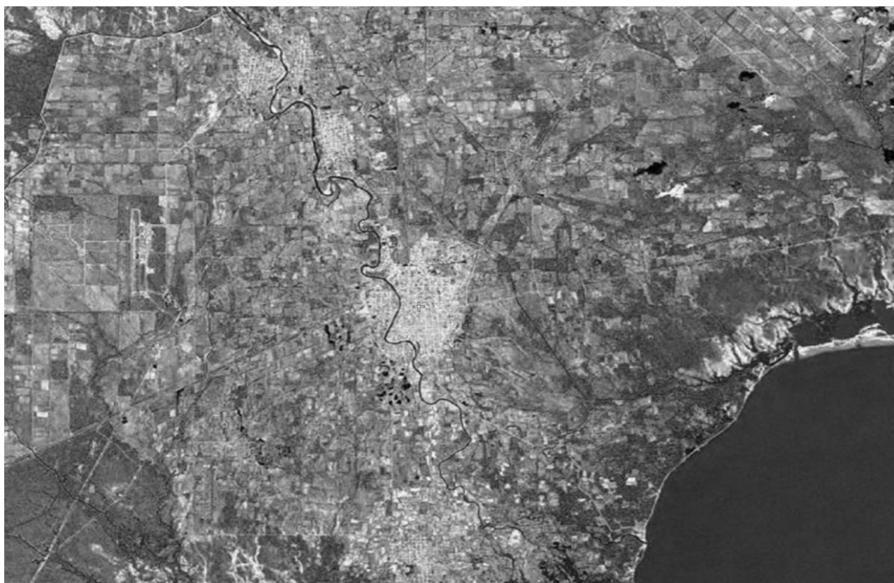
Figura 3. Juchitán o Xaavizende