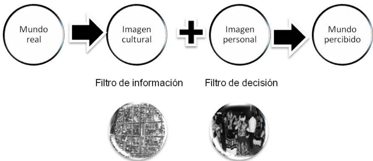
Figura 1. El proceso de la percepción en Geografía