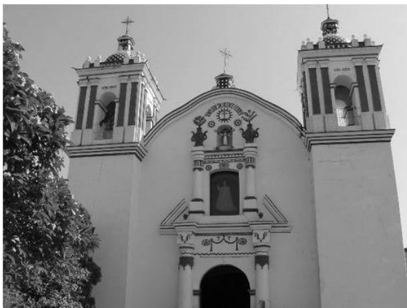
Parroquia de San Vicente Ferrer