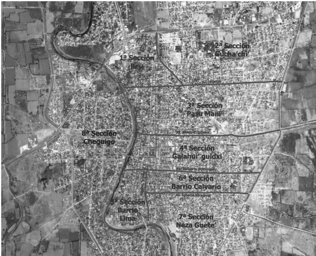
Figura 5. Secciones en que se divide Juchitán 4