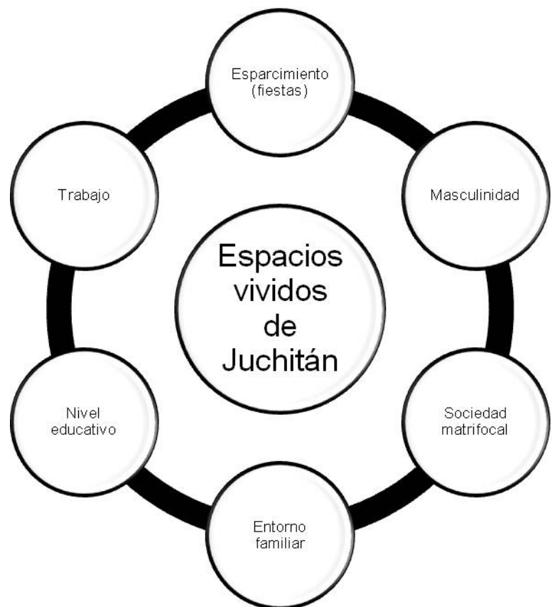
Figura 6. Espacios vividos en función de las masculinidades de Juchitán

Como se ha podido advertir, las fiestas son un elemento primordial en la organización social y cultural de la ciudad de Juchitán, constituyen una