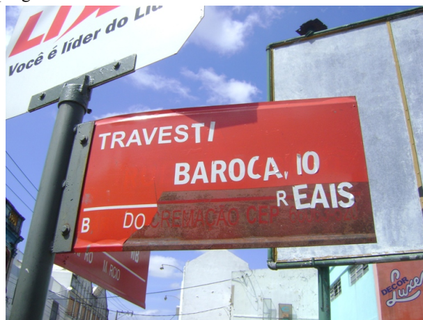
Figura 4. Placa modificada com detalhe para o valor do programa.

Olha, menino, agora me recordando das ideias, elas são assim mesmo, sabe? Ousadas, abusadas mesmo. Ali [Reduto] o negócio é assim: as mais velhas atacam de um lado e as mais novas revidam de outro. E assim a vida vai seguindo. Claro que elas fizeram isso quando as