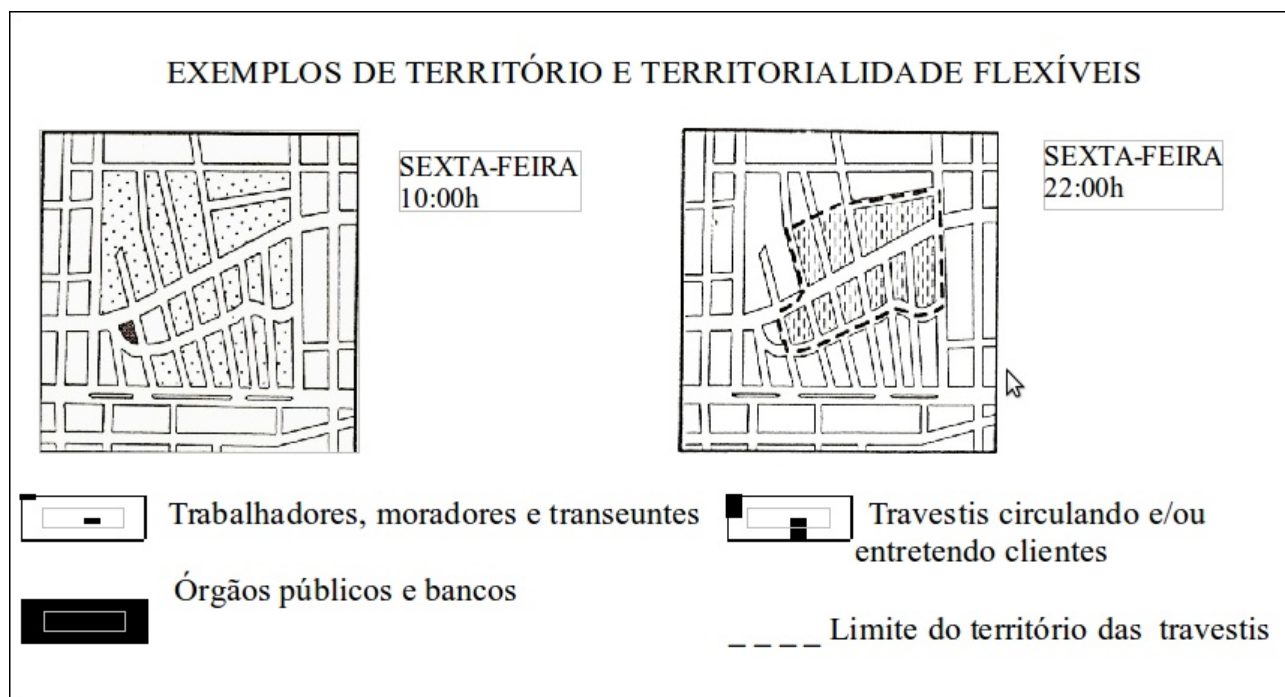
Figura 1: Parte da área de prostituição, no bairro do Reduto, em dois momentos distintos (Adaptado de Souza (2006)).

noite se distingue do dia, mesmo que não haja uma modificação estrutural dos prédios. A luz, proveniente dos portes funcionam como foco teatral, fornecem um novo cenário, uma nova dinâmica de forma, cores e movimentos. Os passantes diurnos cedem lugar aos frequentadores dos estabelecimentos comerciais noturnos, aos michês e às travestis.