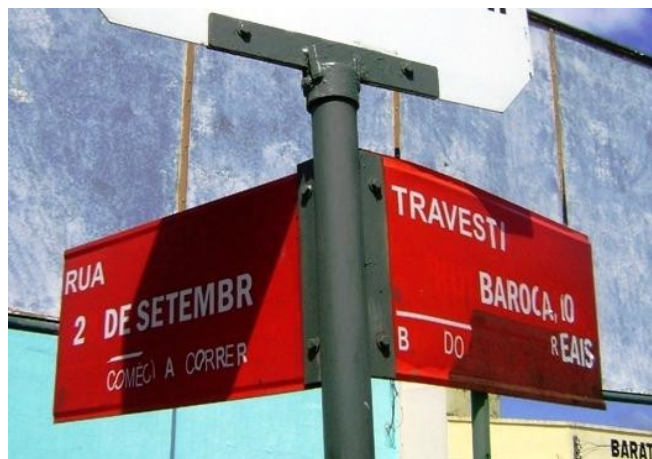
Figura 3. Demarcação simbólica do território.

O território paradoxal é gestado pela violência, funcionando como um ritual de passagem, orientado a corpos que desejam aceitação no território. Outro elemento deste controle é a humildade, atitude esperada das novas travestis, relacionada a um conjunto de deveres e regras de comportamento àquelas desejosas de pertencer ao grupo e ao território da prostituição. Ser humilde para o grupo é admitir que é nova, colocando seu corpo no lugar relacionado a (sic) periferia das relações de poder (ORNAT, 2008, p. 112).