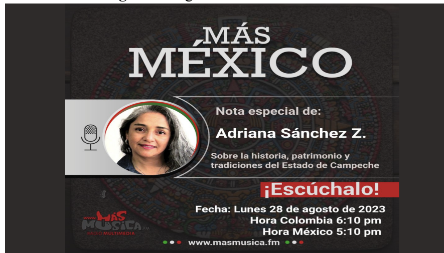
Imagen 2. Programa de radio Más México