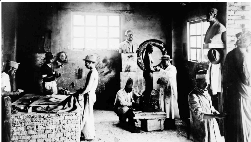
Figura 1 - Alunos na Oficina Artística da Escola Profissional Delfim Moreira, do ano de 1935