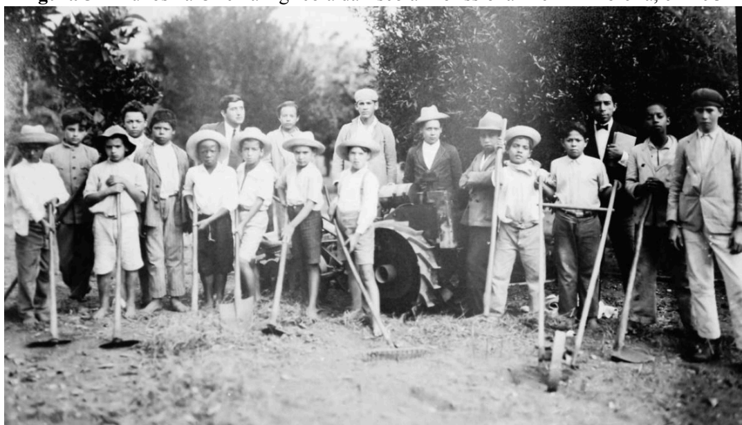
Figura 5 - Alunos na Oficina Agrícola da Escola Profissional Delfim Moreira, em 1934

Fonte: Disponível no Acervo do Museu Municipal Tuany Toledo.