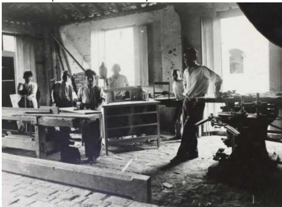
Figura 3 - Alunos presentes na oficina de Carpintaria e Marcenaria da Escola Profissional.