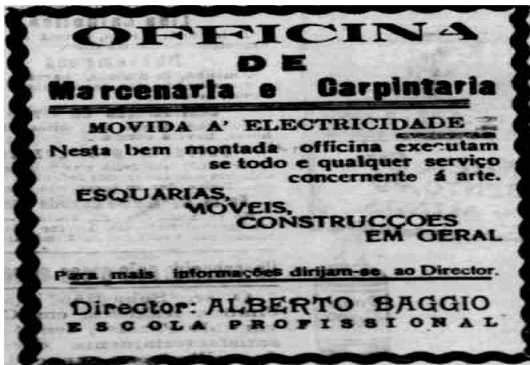
Figura 4 - Anúncio da Oficina de Marcenaria e Carpintaria da E. Profissional