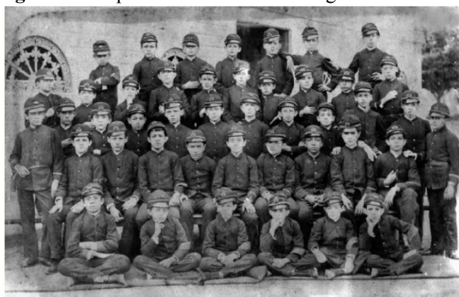
Imagem 2 – Os primeiros alunos do Colégio Militar de 1889

Em 06 de Maio de 1889, a Gazeta de Notícias publica a convocação de 45 alunos 8 para matrícula “[...] convido os Srs. pais, tutores e correspondentes dos candidatos à matrícula n’este Colégio serem inspeccionados e matriculados, visto já terem obtido a competente licença” ( Gazeta de Notícias , 1889, p. 3), abaixo mostramos uma imagem dos primeiros alunos matriculados.