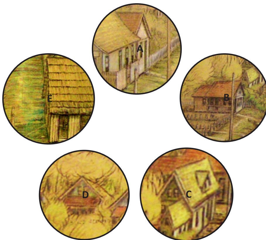
Figura 4: Edificações de madeira dos primórdios de Irati retratadas pelo artista Primo Araújo.

Fonte: Acervo de Zeca Araújo. Org.: das autoras.