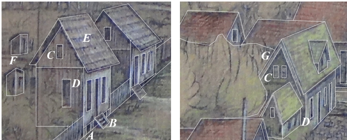
Figura 3: Detalhes construtivos das edificações em madeira retratadas no desenho de Primo Araújo.

LEGENDA A. Base da edificação B. Escada de acesso C. Sótão