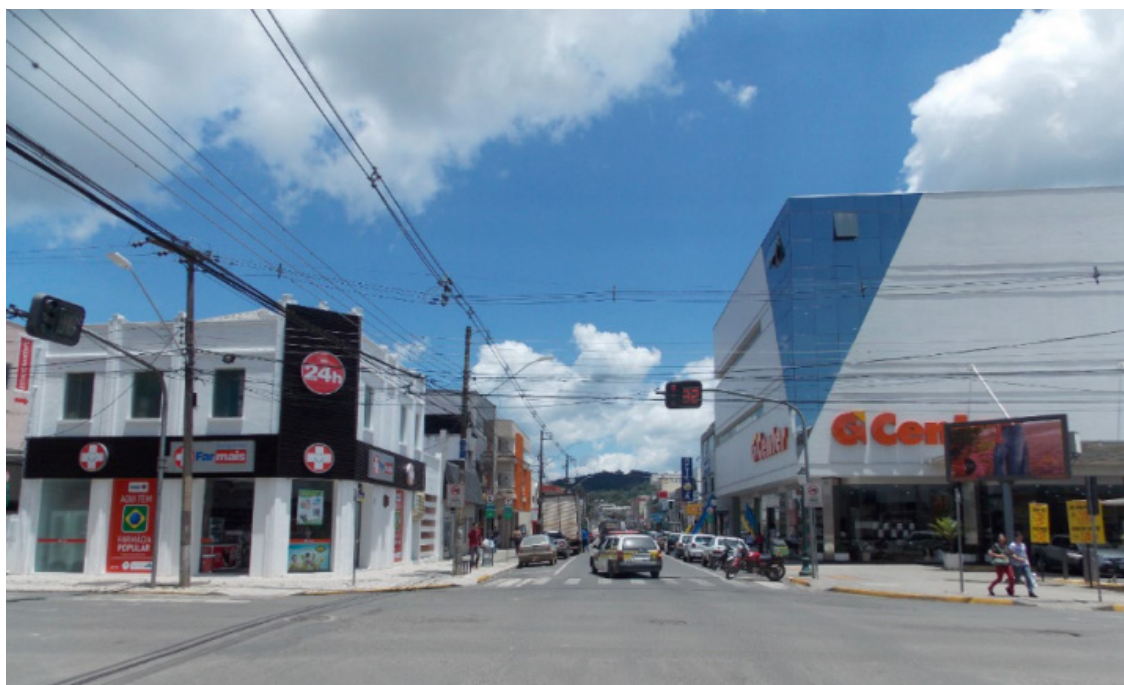
Figura 5: Registro fotográfico da paisagem atual da Rua Munhoz da Rocha.

Buscando verificar a permanência de elementos da paisagem de Irati no início do século XX retratada por Primo Araújo, foram realizadas observações in loco . Comparando este eixo retratado pelo artista com a situação atual da Rua Munhoz da Rocha (Fig. 5), no trecho entre as ruas XV de Novembro e a XV de Julho, foi possível identificar duas permanências: o traçado das ruas e uma edificação em madeira.