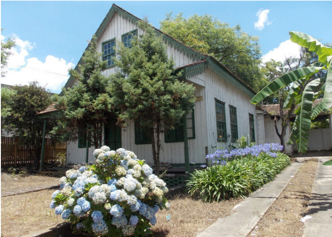
Figura 6: 'Casa do Papai Noel' - registro fotográfico atual da edificação em madeira remanescente na Rua Munhoz da Rocha.