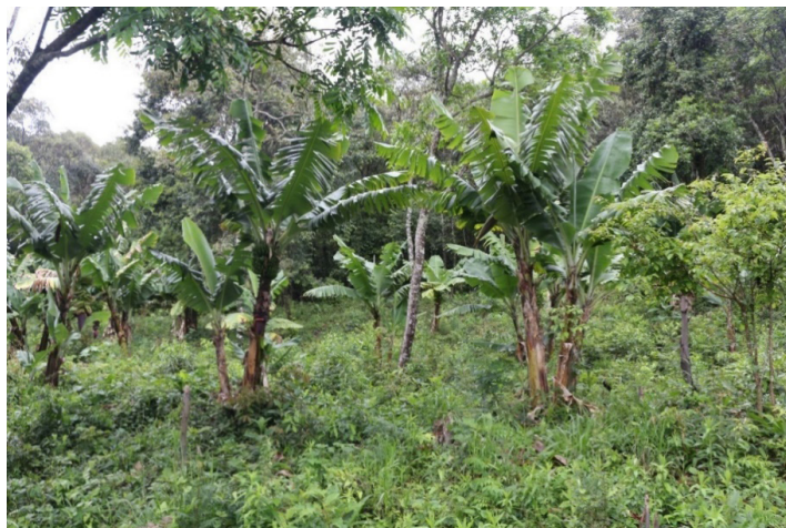
Figura 3: Agrofloresta Recanto da Natureza, Laranjeiras do Sul, PR.

No levantamento fitossociológico desta agrofloresta (Quadro 1) foi verificada a ocorrência de 130 indivíduos pertencentes a 24 espécies e 14 famílias botânicas, das quais