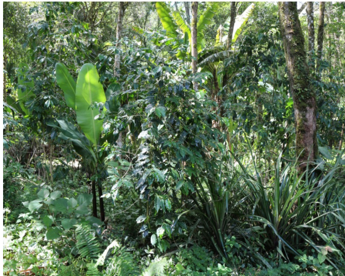
Figura 4: Agrofloresta Vila Velha, Rio Bonito do Iguaçu, PR.

Na área da agrofloresta ocorrem 187 indivíduos arbóreos (Quadro 2), pertencentes a 18 famílias botânicas e a 37 espécies, das quais 31 são nativas do ecossistema analisado, uma é nativa do bioma Mata Atlântica, porém não do ecossistema analisado e cinco são exóticas. As espécies com maior ocorrência foram respectivamente: rabo-de-bugio ( Lonchocarpus muehlbergianus ), com 19 indivíduos, açoita-cavalo ( Luehea divaricata ), com 17 indivíduos e pessegueiro-bravo ( Prunus myrtifolia ), com 15 indivíduos. As famílias botânicas mais representativas foram Fabaceae, com seis espécies, Lauraceae (5) e Euphorbiaceae, Meliaceae e Myrtaceae, com três espécies cada. Quanto ao status de conservação constam cinco espécies em diversas categorias de ameaça.