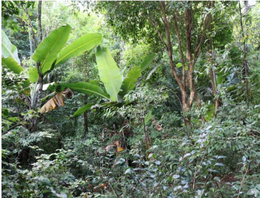
Figura 5: Agrofloresta Oito de Junho, Laranjeiras do Sul, PR.

Nessa agrofloresta foram analisadas 139 árvores (Quadro 3), que integram 11 famílias botânicas e 24 espécies, sendo que 22 são nativas e duas são exóticas: uva-do-Japão ( Hovenia dulcis ) e Eucalipto ( Eucalyptus sp.). As espécies mais frequentes na área foram respectivamente: sapuvão ( Machaerium paraguariense ) com 33 indivíduos; guabirobeira ( Campomanesia xanthocarpa ) com 31 indivíduos; uva-do-Japão ( Hovenia dulcis ) com 13 indivíduos e angico-gurucaia ( Parapiptadenia rigida ) com oito indivíduos. As famílias botânicas mais representativas foram Myrtaceae, com três espécies, Fabaceae e Lauraceae, com quatro espécies, Salicaceae, com três, Sapindaceae, com duas espécies, enquanto as demais famílias ocorrentes apresentaram somente uma espécie cada. Quanto ao status de conservação constam duas espécies em diversas categorias de ameaça.