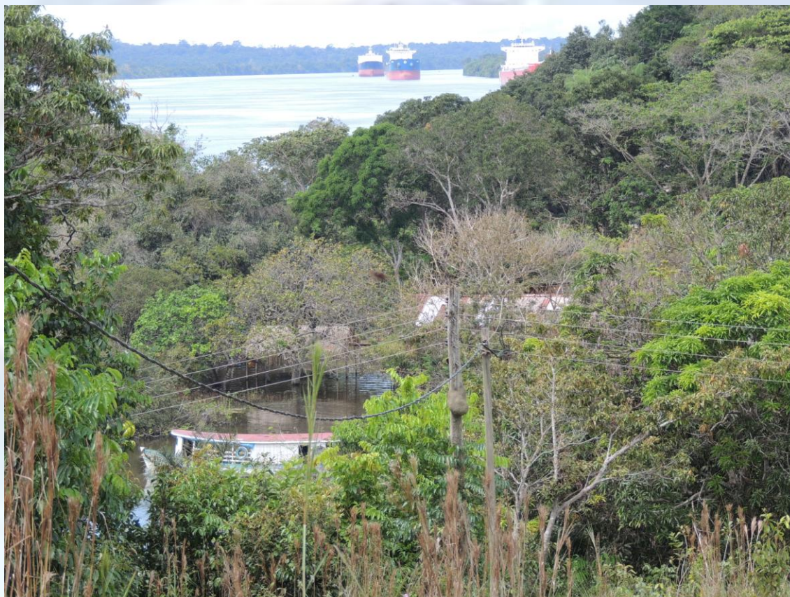
Figura 03: Vista a partir do "alto do barranco", no quilombo Boa Vista.

A comunidade quilombola Boa Vista tem sua espacialidade construída pela descida das 'águas brava', localizadas no alto rio Trombetas, com trechos encachoeirados e de difícil acesso, para áreas mais próximas da cidade de Oriximiná. De acordo com os quilombolas entrevistados, o nome Boa Vista advém da boa visibilidade do rio e da floresta, uma vez que se encontra 'no alto de um barranco', permitindo a vigilância e uma visão privilegiada (Figura 03).