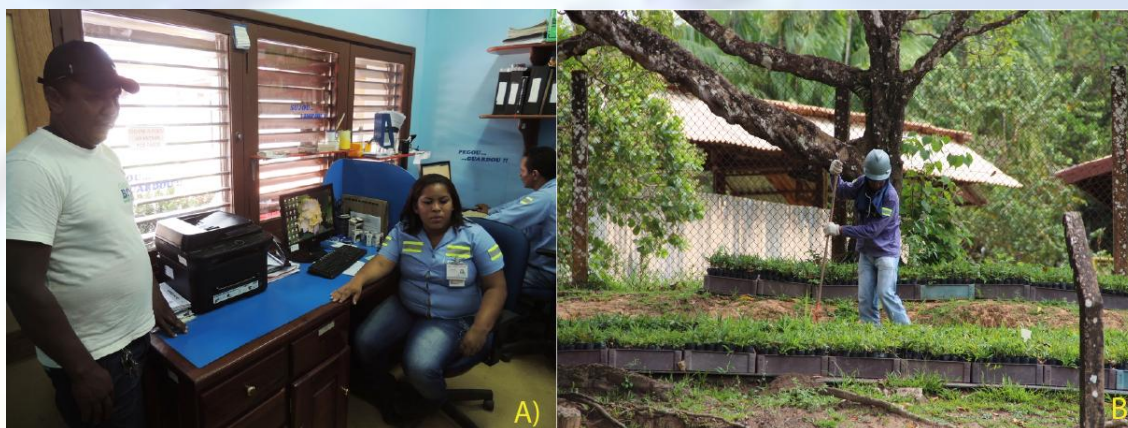
Figura 04: (A) Escritório administrativo da COOPERBOA, na área da Company Town Trombetas. (B) Trabalhador Quilombola prestando serviço à Mineradora na função de auxiliar de serviços gerais (ASG), na parte do Horto do Projeto.

Comunidade do Boa Vista (COOPERBOA), com o objetivo de prestar serviços diversos para a company town Trombetas e a atividade mineradora (ver Figura 04). Os cargos contratados pela Mineradora, através da Cooperativa, foram e continuam sendo basicamente nas atividades de zeladoria, auxiliar de serviços gerais, serviços de campo, operador de roçadeira, operador de máquina roçadeira lateral e motorista de veículos leves.