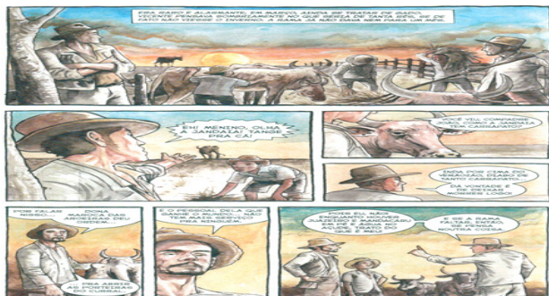
Imagem 3: Adaptação de o quinze à luz das hqs

pelo processo, a partir do despontar da voz feminina no contexto literário responsável por projetar novos horizontes para que outras escritoras tivessem espaço para se firmarem no contexto literário brasileiro.