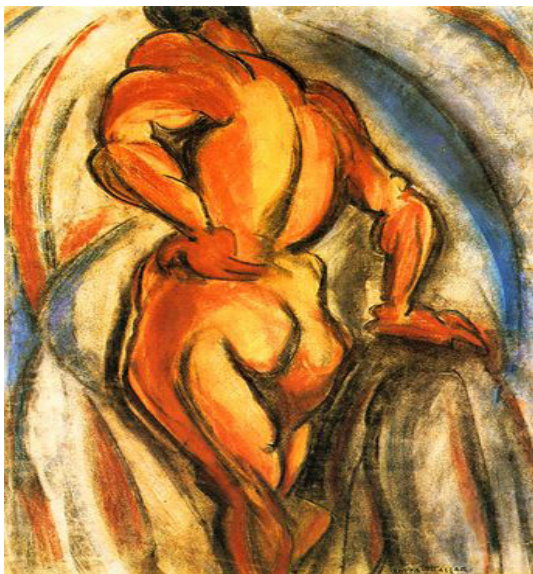
Imagem 1: O torso, de Anita Malfatti